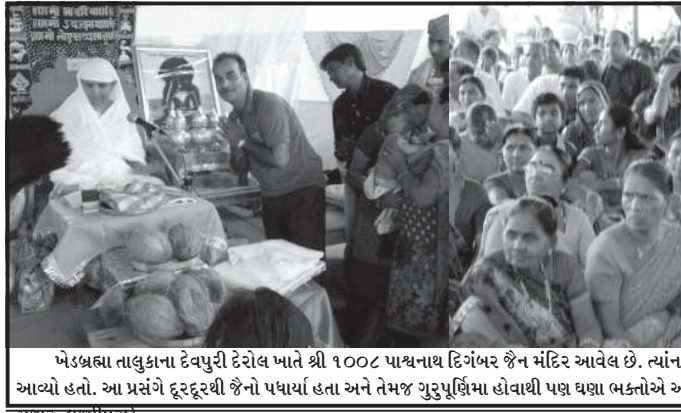
બેઠકમાં તાલુકાના દેવપુરી દેરોલ ખાતે શ્રી ૧૦૦૮ પાશ્વનાથ દિગંબર જેન મંદિર આવેલ છે. ત્યાંના શ્રી ૧૦૫ સુર્યમતી માતાના મંદિર ખાતે યાત્રુમાસ નિમિત્તે કળશ સ્થાપનનો કાર્યક્રમ ધામધૂમથી ઉજવવામાં આવ્યો હતો. આ પ્રસંગે દૂરદૂરથી જેનો પધાર્યા હતા અને તેમજ ગુરુપૂર્ણિમા હોવાથી પણ ઘણા ભક્તોએ આ કાર્યક્રમનો લાભ લીધો હતો.