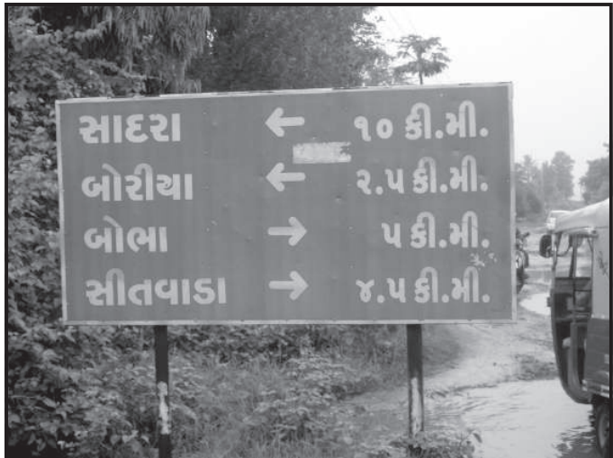
તંત્રની બેદરકારી... પ્રાંતિજ પાસે ગ્રામ્ય વિસ્તાર તરફના ગામો સાદરા, બોરીયા, બોલા સીતવાડા, તરફ જવાના ગામો તરફની દિશા સુચક નિશાની (→) બોટી રીતે દર્શાવવામાં આવી છે. જેથી દિવસ દરમિયાન અસંખ્ય લોકો મુંઝવાય છે તેમ છતાં તંત્ર ધ્યાને કંઈ જ આવતું નથી.