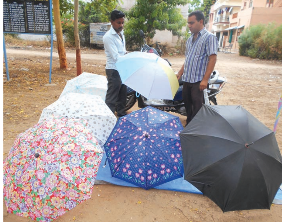
છત્રી પણ વરસાદના વિરહમાં... શહેરમાં આજકાલ રંગબેરંગી છત્રીઓ ઠેર ઠેર ગોઠવાઈ છે પણ વરસાદ વિના નથી છત્રીની કામગીરી કે નથી છત્રીનું બજાર ખૂલ્યું... છત્રી પણ વરસાદમાં ભીંજવાની રાહ જુએ છે. છત્રીના જીવતરની યથાર્થતા જ વરસાદ છે. ખુલવું... બંધ થવું, પલળવું અને સુકાવવું... એ જ છત્રીના જીવનનો નિત્યક્રમ છે. આકાશમાંથી વરસતી કૃપાને ઝીલવી અને માનવને વરસાદની જીકમાંથી બચાવવો એ છત્રીનો ગુણધર્મ છે. છત્રી પોતે ભીંજાઈને એના ધારકને કોરાકટ રાખે છે.