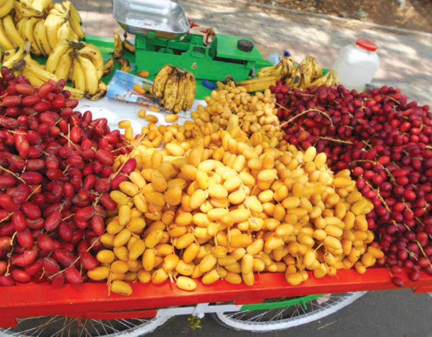
વરસાદ આવે કે ન આવે, વ્રતોની મોસમ નજદીક આવી રહી છે અને આ મોસમમાં ઉપવાસ ટાણે ઉપયોગી એવાં ફળો પણ બજારમાં ભરપૂર પ્રમાણમાં દેખાઈ રહ્યાં છે. એ પૈકી કુમારિકાઓને સૌથી વધુ ભાવતી અને એમના દ્વારા કરાતા વ્રતોમાં ઉપયોગમાં લેવામાં આવતી લાલ-પીળી ખારેક અને ઉપવાસ માટે વર્ષભર, ઓલટાઈમ હીટ કેળાં પણ તસવીરમાં દ્રશ્યમાન થાય છે.