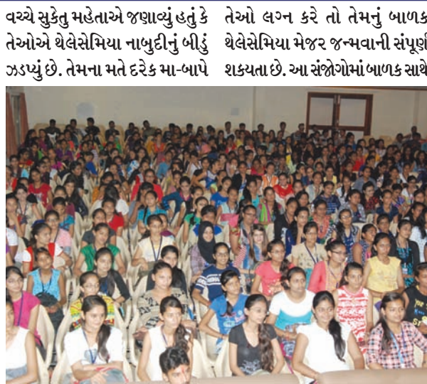
પોતાના સંતાનના લગ્ન કરાવતા જન્મકુંડળી મેળવવા કરતા મેડીકલ રિપોર્ટસ મેળવવા જોઈએ. બે વ્યક્તિ જો થેલેસેમિયા માઈનોર હોય અને

ગાંધીનગર, તા. ૪ 'જો તમને યુવાવસ્થામાં પ્રેમ થઈ જાય અને તમે લગ્ન કરવાનું વિચારતા હોવ તો પહેલા થેલેસેમિયાનો ટેસ્ટ કરાવી લેજો. જો ટેસ્ટમાં એવું આવે કે તમે બંને થેલેસેમિયા માઈનોર છો તો પ્રેમ ભૂલી રાખડી બંધાવી છુટા પડી જજો, એમાં જ તમારી ભલાઈ હશે.'