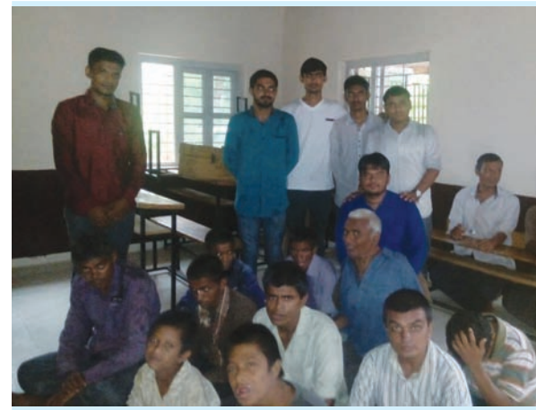
યાર રસ્તા ખાતેની માનવસ્મૃતિ સંસ્થામાં માનસિક રીતે વિશિષ્ટ બાળકો સાથે પસાર કરી ઉજવ્યો હતો. આ પ્રસંગે તેમણે બાળકોને આઈ.સ્ટીમ ખવડાવી મઠો મીઠું કરાવતા બાળકોના ચહેરા પર સ્મિત રેલાવ્યું હતું. એક તરફ આજની યુવા પદ્વી નાની નાની બાબતોમાં પાર્ટી-હોટલોમાં નાણા વેડકે છે ત્યારે બીજી તરફ એવા પણ યુવાનો છે જેઓ જરૂરિયાતમંદોને મદદરૂપ થઈ પોતાની ખુશીમાં અન્યને પણ ખુશ કરી સાચો આનંદ માણે છે.