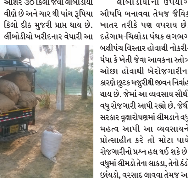
વિસ્તારોમાં અસંખ્ય લીલા લીમડાના વૃક્ષ આવેલા છે. આ વૃક્ષો ઉપર ઉનાળાના એપ્રિલ, મે અને જુન માસ દરમિયાન લીંબોડીયો નામનું ફળ આવે છે. તે તીવ્ર પવનની ગતિ, વાવાઝોડું કે વરસાદી ઝાપટું પડે ત્યારે ટપોટપ ખરી પડે છે. આ પાકી થઈને ખરી પડેલી લીંબોડીયો દેવકરણના મુવાડા લોડીંગ રીક્ષા, આઈશર, જીપડાવા જેવા વાહનો ભાડે લાવતા હોય છે. જેમાં ભરીને દેવકરણના મુવાડા ગામે લઈ જવાય છે. એક મહિલા દૈનિક પ્રવૃત્તિ માટે આ મહિલાઓને આવવા જવાનું ભાડુ, ભોજન સહિત તમામ ખર્ચ ઉપાડી લે છે જેથી મહિલાઓને ચોખ્ખી આવક થતી હોય છે.

કામ કરે છે અને મોટી સંખ્યામાં હોવાથી ગ્રુપ બનાવી લંબોડીયો એકઠી કરે છે અને સવારથી જ આ કામગીરીમાં જોતરાય છે. સાથે આશરે ૩૦ કિલો જેવી લીંબોડીયો વીણે છે અને ચાર થી પાંચ રૂપિયા કિલો દીઠ મુજરી પ્રાપ્ત થાય છે. લીંબોડીયો ખરીદનાર વેપારી આ વીંબોડીયોનો ઉપયોગ ઔષધિ બનાવવા તેમજ જૈવિક ખાતર તરીકે પણ વપરાય છે. દહેગામ-ચિલોડા પંથક લગભગ બક્ષીપંચ વિસ્તાર હોવાથી નોકરી-ધંધા કે ખેતી જેવા આવકના સ્ત્રોત ઓછા હોવાથી બેરોજગારીના કારણે છૂટક મજૂરીથી જીવન નિવાહ થાય છે. જેમાં આ વ્યવસાય સૌથી વધુ રોજગારી આપી રહ્યો છે. જેથી સરકાર વૃક્ષારોપણમાં લીમડાને વધુ મહત્વ આપી આ વ્યવસાયને પ્રોત્સાહીત કરે તો મોટા પાયે રોજગારીનો પ્રશ્ન હલ થઈ શકે છે. વધુમાં લીમડો તેના લાકડા, તેનો ઠંડો છાંયડો, વરસાદ લાવવા તેમજ આ લીંબોડીયાના વ્યવસાયમાં ખુબ જ ઉપયોગી બને છે અને ગરીબ લોકોને આજીવિકા ઉભી થાય છે.