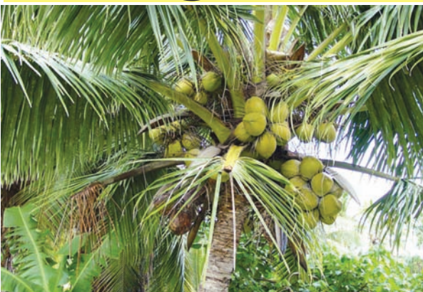
નહી વૃક્ષ, નહીં છોડ, નહીં ઘાસ. પામ વૃક્ષ કહીએ છીએ પણ તે વનસ્પતિ શાસ્ત્રમાં વૃક્ષની વ્યાખ્યા સાથે બંધબેસતું નથી.

સોપારી (Araca catuchu), તાડ (Borassus flabellifer), નાળિયેરી (Cocos nucifera), નેતર (કન) (Calamus Fenuis), ખજૂરી, (Phoenix sylvestris), પામ ઓઈલ (Elaeis guineensis) આ બધા પામ એટલે કે પામી (Palmae) કુટુંબના આપણાં કેટલાક જાણીતા વૃક્ષો. ગુજરાતીમાં આપણે તેને ‘તાડાદિ કુળ’ પણ કહીએ છીએ.