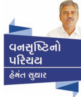
વનસૂષ્ટિનો પરિચય હેમંત સુધાર

રોચલ કે બોટલ પામ, પંખા પામ, શિવજટા પામ જેવા પામ વૃક્ષો