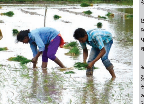
ડાંગર રોપણી : જિલ્લાના નદી પાર વિસ્તારમાં વરસાદના બે ઝાપટા પડતા ડાંગર રોપણીનું કામ પૂરજોશમાં આરંભાયું છે. જિલ્લામાં દહેગામ અને ચિલોડા વિસ્તારમાં ડાંગરનો પાક વ્યાપક પ્રમાણમાં લેવાય છે.