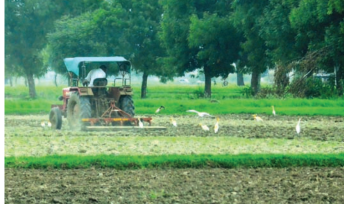
ડાંગર રોપણી : જિલ્લાના નદી પાર વિસ્તારમાં વરસાદના બે ઝાપટા પડતા ડાંગર રોપણીનું કામ પૂરજોશમાં આરંભાયું છે. જિલ્લામાં દહેગામ અને ચિલોડા વિસ્તારમાં ડાંગરનો પાક વ્યાપક પ્રમાણમાં લેવાય છે.

બાબતોની ચકાસણી કરી વિગતવાર અહેવાલ તૈયાર કરવાનો રહેશે. જિલ્લામાં હાલ ૩૦૦ ગામોમાં ઈ.ગ્રામ સેન્ટર કાર્યરત છે. જ્યાં આર.ઓ.આર. અને જીઈબીના બિલ કનેક્શન સેન્ટર, કિસાન પોર્ટલ તેમજ અપના સીએસસીની સેવાઓ ઉપલબ્ધ છે. જે ઉલ્લેખનીય છે. બીજી તરફ જિલ્લાના ૩૮ જેટલા ગામોના ઈ.ગ્રામ સેન્ટરોના અપગ્રેડેશનને પણ મંજૂરી આપી દેવામાં આવી છે જે પણ ઉલ્લેખનીય છે. જિલ્લાતંત્ર આ બધી કામગીરી આગામી બે માસમાં પૂર્ણ કરી અને ડિજિટલ વિલેજ માટેની દરખાસ્ત તૈયાર કરશે તેમ પંચાયતના વિશ્વસનીય સૂત્રોએ જણાવ્યું છે.