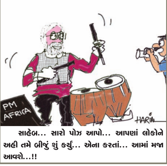
સાહેબ... સારો પોઝ આપો... આપણાં લોકોને અહીં તમે ઊંચું શું કર્યું... એના કરતાં... આમાં મજા આવશે...!!