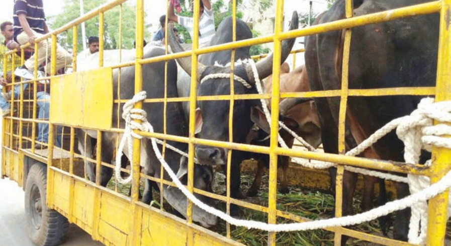
રખડતા ઢોર પકડાયા : શહેરમાં ચોમાસાના આરંભની સાથે જ રખડતા ઢોરની સમસ્યા ઘેરી બને છે. દબાણ-ગંદકીની સાથોસાથ રખડતા ઢોરનો પ્રશ્ન પણ શહેર માટે શીરદર્દ છે. મહાનગરપાલિકાના તંત્ર દ્વારા છેલ્લા બે દિવસથી ઢોર પકડવાની ઝૂંબેશ વેગવતી બનાવી છે.

પંચાયતના સભ્યોને વાંધો પડ્યો છે. આજે જિલ્લા પંચાયત પ્રમુખ, ઉપપ્રમુખ અને કારોબારી સમિતિના ચેરમેનનોની કોંગ્રેસના પ્રભારી ગુરુદાસ કામતે બેઠક અમદાવાદ બોલાવી છે. ● આજે જિલ્લા પંચાયત પ્રમુખ, ઉપપ્રમુખ અને કારોબારી સમિતિના ચેરમેનનોની કોંગ્રેસના પ્રભારી ગુરુદાસ કામતે બેઠક અમદાવાદ બોલાવી છે.