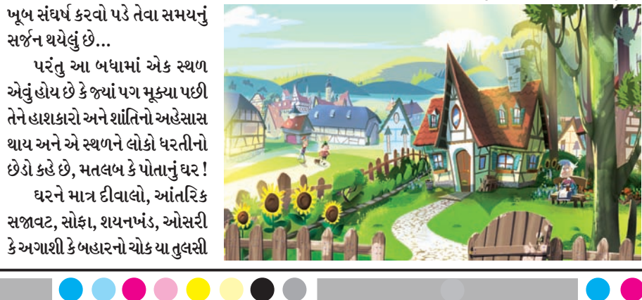
પરંતુ આ બધામાં એક સ્થળ એવું હોય છે કે જ્યાં પગ મૂક્યા પછી તેને હાથકારો અને શાંતિનો અહેસાસ થાય અને એ સ્થળને લોકો ધરતીનો છેડો કહે છે, મતલબ કે પોતાનું ઘર! ઘરને માત્ર દીવાલો, આંતરિક સજાવટ, સોફા, શયનખંડ, ઓસરી કે અગાશી કે બહારનો ચોક યા તુલસી