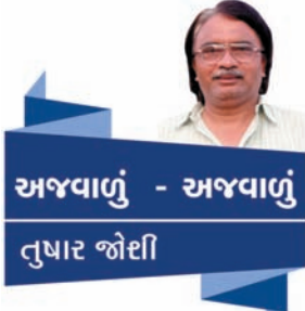
અજવાળું - અજવાળું તુષાર જોઈ

આખરે સ્વસ્થ થઈને, યાનાસ્તો કરીને ફરી હોસ્પિટલથી એક નવી રીક્ષામાં તેઓ નીકળ્યા એમના શ્રદ્ધેય વ્યક્તિત્વ અને ભૂમિ તરફ... ગુરુપૂર્ણિમાના અવસરમાં મોડા મોડા પણ શામિલ તો થયા જ. ભલે નાનકડો અકસ્માત હતો પરંતુ મનથી હિંમત હાર્યા વિના હૃદયમાં પૂર્ણ શ્રદ્ધા હતી એટલે મનમાં નક્કી કરેલો મનોરથ પૂર્ણ કરી શક્યા. ભક્તિ - શ્રદ્ધા-વિશ્વાસ - જે કહો તે એના બળ પર પહોંચ્યા અને ગુરુપૂર્ણિમાના અવસરનો આનંદ લઈ શક્યા જેના સ્મરણથી એમનો વિશ્વાસ વધુને વધુ સંવર્ધિત થતો હતો.