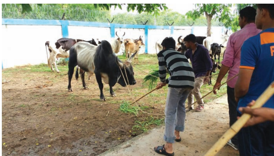
રખડતા ઢોર પકડવાની ઝુંબેશ : શહેરમાં આજકાલ રખડતા ઢોરના ત્રાસને નાથવા તંત્ર દ્વારા ખાસ અભિયાન ચલાવાય છે... ભેંસો, ગાયો અને આખલાઓ શહેરના મુખ્ય માર્ગો અને આંતરિક માર્ગો પર વાહન ચાલકો માટે હાલાકી સર્જતા હોય છે... ત્યારે આ ઝુંબેશ આશીર્વાદરૂપ બની રહેશે... રખડતા ઢોરથી ગંદકી પણ ખુબ થાય છે... આમ સ્વચ્છ ગાંધીનગરના સ્વપ્નને સાકાર કરવામાં રખડતા ઢોરને પકડવાની કામગીરી પૂરક બનશે...

ગાંધીનગર, તા. ૧૮ આજે ગાંધીનગર મહાનગર પાલિકાની સ્થાયી સમિતિની મળનારી બેઠકમાં કાઉન્સિલરોને અપાતી વિકાસ ગ્રાન્ટ અંગેની નવી નીતિને આખરી ઓપ આપવામાં આવશે. મહાનગરપાલિકાની સ્થાયી સમિતિની બેઠક બપોરે ૩.૩૦ વાગે મનપાની કચેરીમાં આવેલ સ્થાયી સમિતિના સભાખંડમાં મળશે. મળતી વિગતો પ્રમાણે આ બેઠકમાં નગરના કાઉન્સિલરોને વિસ્તારમંચના કામો હાથ ધરવા અંગેની નીતિ આખરી કરી દેવામાં આવશે. તાજેતરમાં મળેલ સામાન્ય સભામાં મેયર પ્રવિણ પટેલે આ નીતિ