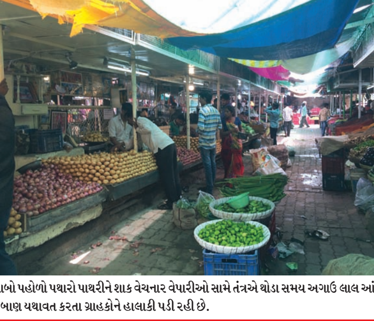
શાક માર્કેટમાં દબાણ યથાવત : સેક્ટર-૨ ૧ના શાકમાર્કેટમાં ફાળવેલ જગ્યા કરતા પણ લાભો પહોળો પથારીને શાક વેચનાર વેપારીઓ સામે તંત્રએ થોડા સમય અગાઉ લાલ આંખ કરી હતી. ગ્રાહકો માટે ચાલવાના રસ્તા પર દબાણ કરનારા શાકભાજીના વેપારીઓએ પુનઃ દબાણ યથાવત કરતા ગ્રાહકોને હાલાકી પડી રહી છે.

ખૂણો ખાંચરેલી... ● ગાંધીનગર જિલ્લા પંચાયતની વેબસાઈટના અપડેટશનને લઈ આજે શાખાધિકારીઓની બેઠક મળી હતી. ● દહેગામ તાલુકાના કંથારપુરાના સરપંચને દબાણો દૂર નહિ કરવા બદલ નોટીસ ફટકારવામાં આવી છે. ● આજે વિકાસ કમિશનરે વિકાસના કામોની સમીક્ષા વિડીયો કોન્ફરન્સ યોજી કરી હતી. ● જિલ્લા પંચાયતમાં એ.સી. મશીનો માટે વધુ પાવર સપ્લાયની માંગ કરાતાં હવે તેના માટે અલાયદો રૂમ બનાવવામાં આવશે. જેમાં વોલ્ટેજ કન્ટ્રોલ મશન યુનિટ નાંકવામાં આવશે. ● સચિવાલયના અને બિનાસચિવાલય કર્મચારી સંગઠનોની આજે સામાહિકી બેઠકો યોજાઈ હતી. ● મુખ્યમંત્રી ગ્રામ સડક યોજના અંતર્ગત ગાંધીનગર(ઉ)ના ધારાસભ્ય અશોક પટેલના વિસ્તારમાં રૂ. ૧૫ કરોડના માર્ગના કામો મંજૂર થતાં તેમણે મંત્રી નીતિન પટેલ અને મુખ્યમંત્રીનો આભાર માનતો પત્ર લખ્યો છે. ● ગૌરીવ્રતા જાગરણને લઈ જિલ્લા કલેક્ટરે દરેક ચિયેટરોને એકરૂટ્ટ શો ની મંજૂરી પોલીસના અભિપ્રાય પછી આપી છે.