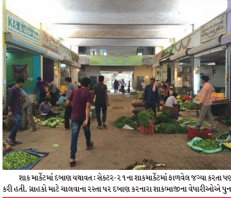
શાક માર્કેટમાં દબાણ યથાવત : સેક્ટર-૨ ૧ના શાકમાર્કેટમાં ફાળવેલ જગ્યા કરતા પણ લાભો પહોળો પથારીને શાક વેચનાર વેપારીઓ સામે તંત્રએ થોડા સમય અગાઉ લાલ આંખ કરી હતી. ગ્રાહકો માટે ચાલવાના રસ્તા પર દબાણ કરનારા શાકભાજીના વેપારીઓએ પુનઃ દબાણ યથાવત કરતા ગ્રાહકોને હાલાકી પડી રહી છે.