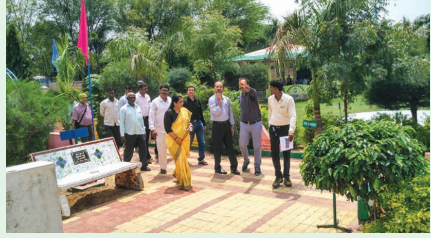
પણ આ યોજનાનો અમલ કરવાના ઈરાદે ગાંધીનગરની શાળાઓમાં શિક્ષણની ગુણવત્તા તેમજ પદ્ધતિનું નિરીક્ષણ કર્યું હતું.

આસામ શિક્ષણ વિભાગનું ડેલીગેશન પ્રવેશોત્સવ અને ગુણોત્સવની યોજનાથી પ્રભાવિત જિલ્લાની વિવિધ શાળાઓની મુલાકાત લીધી : શિક્ષણની ગુણવત્તા તેમજ પદ્ધતિ અંગે પણ અભ્યાસ કર્યો ગાંધીનગર તા. ૨૦ આસામ શિક્ષણ વિભાગના એક ડેલીગેશનને આજે ગાંધીનગર જિલ્લાની વિવિધ શાળાઓની મુલાકાત લીધી હતી. રાજ્યમાં શિક્ષણ ક્ષેત્રે હાથ ધરાયેલી ગુણોત્સવ અને પ્રવેશોત્સવની યોજનાથી આ ડેલીગેશનના સભ્યો પ્રભાવિત થયા હતા. આસામમાં