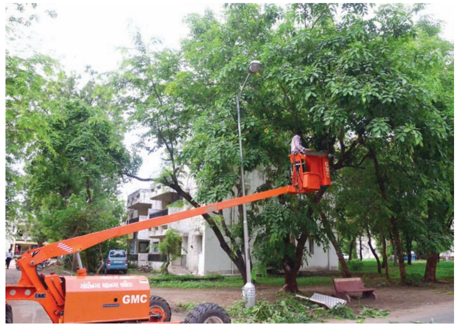
ટ્રીમીંગ : શહેરના આંતરીક માર્ગો પર વૃક્ષોનું ટ્રીમીંગ પૂરજોશમાં ચાલી રહ્યું છે. ચોમાસાની સિઝનમાં વરસાદના પાણીથી લચી પડેલા વૃક્ષોને કારણે વાહનચાલકોને ભારે હાલાકી પડે છે. શહેરમાં વારંવાર જાગતી ફરીયાદોને પગલે મહાનગરપાલિકા દ્વારા વૃક્ષોનું ટ્રીમીંગ કરાઈ રહ્યું છે.

ગાંધીનગર, તા. ૨૭ ગાંધીનગર જિલ્લા ક્ષય કેન્દ્ર દ્વારા શહેરને અડીને આવેલા મોટી આદરજ ગામની એસ.એમ.કે.શાહ માધ્યમિક શાળા ખાતે બાળકોને ટી.બી.ના રોગ વિશે જાગૃતિ કાર્યક્રમ યોજાયો હતો. જેમાં બાળકોને ટી.બી.ના રોગ અંગે જિલ્લા ક્ષય કેન્દ્રના અધિકારીઓએ અંગે સંપૂર્ણ માહિતી પુરી પાડવામાં આવી હતી. ક્ષય રોગ એ ગંભીર બિમારી છે. ગુજરાતમાં ધીમેધીમે આ રોગનો ભરડો વધી રહ્યો છે. આ રોગથી પિતા વ્યક્તિના સંપર્કમાં વારંવાર આવતા વ્યક્તિને પણ આ રોગ થવાની સંભાવના રહે છે. આ રોગની હાજરી ગ્રામ્ય વિસ્તારમાં વધુ જોવા મળે છે માટે જિલ્લા આરોગ્ય કેન્દ્ર કટીબધ્ધ બન્યું છે. સતત જાગૃતિ કાર્યક્રમોનું આયોજન કરતું રહે છે. આ રોગની નિયમિત દવા લેવાથી સંપૂર્ણ મટી શકે છે તેમજ દર્દી પહેલા જેવો સ્વચ્છ થઈ જાય છે. આ રોગની તમામ દવા જિલ્લા ક્ષય કેન્દ્ર દ્વારા નિશૂલ્ક પુરી પાડવામાં આવે છે. ત્યારે આ રોગ અંગે નાગરીકોમાં જાગૃતિ આવે તે અત્યંત જરૂરી બન્યું છે. જેથી આજરોજ શ્રીમતી એસ.એમ.કે.શાહ માધ્યમિક શાળા ખાતે આદરજ મોટી ગામે જિલ્લા ક્ષય કેન્દ્ર દ્વારા ક્ષયના રોગ વિશેની માહિતી પુરી પાડી હતી. જેમાં ટીબી એટલે શું, ટીબીના લક્ષણો, નિદાન, સારવાર અંગેની વિસ્તૃત માહિતી બાળકોને પુરી પાડવામાં આવી હતી. આ સમયે બાળકોએ રાજ્યમાંથી ટીબીને નાબુદ કરવા માટે શાળાના તમામ બાળકોએ શપથ લીધા હતા. જેમાં ટી.બી. મુક્ત આદરજ અને ટી.બી.મુક્ત ગુજરાત માટે યોજાયેલ આ સમગ્ર કાર્યક્રમમાં મોટીસંખ્યામાં વિદ્યાર્થી ભાઈ બહેનો મોટીસંખ્યામાં હાજર રહ્યા હતા. આ પ્રસંગે ડીપીએમએમસીના કેપુર જયસ્વાલ, જિલ્લા ક્ષય કેન્દ્ર ગાંધીનગરના આનંદ પટેલ તેમજ આયુષ્ય મેડીકલ ઓફીસર ડો. હર્ષલભાઈ ભટ્ટ હાજર રહ્યા હતા.