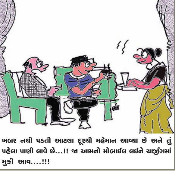
ખબર નથી પડતી આટલા દુરથી મહેમાન આવ્યા છે અને તું પહેલા પાણી લાવે છે...!! જા આમનો મોબાઇલ લઈને ચાર્જિંગમાં મુકી આવ...!!!!