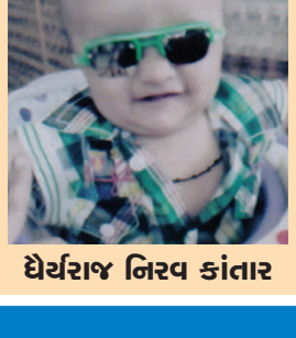
ઘેરજાજ નિરવ કાંતાર