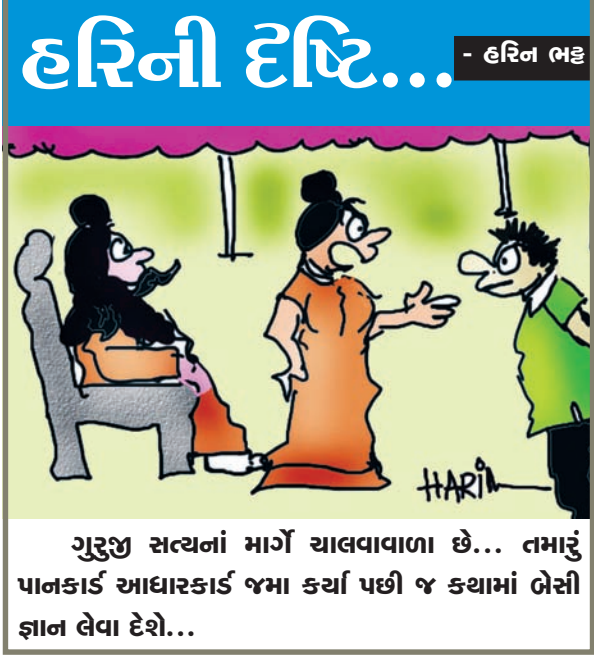
ગુરુજી સત્યનાં માર્ગે ચાલવાવાળા છે... તમારું પાનકાર્ડ આધારકાર્ડ જમા કર્યા પછી જ કથામાં બેસી જ્ઞાન લેવા દેશે...

૨૧મી જૂન આંતરરાષ્ટ્રીય યોગ દિવસની સમગ્રદેશમાં વિવિધ સંસ્થાઓ દ્વારા ભવ્ય રીતે ઉજવણી કરવામાં આવી હતી. વહેલી સવારે યોગ નિયમિતપણે કરીએ ત્યારે દેશના વડપ્રધાન મોદીજી યોગ માટે જાગૃતતા કેળવવા યોગ મિશન સો ટકા સફળ નીવડે. પુરાનુમા વાતાવરણમાં માત્ર ૪૫ મિનિટ યોગ કરવાથી શરીરના અંગેને જરૂરી કસરત મળી રહે. યોગથી બિમારી દૂર થાય સાથે સાથે શારીરિક અને માનસિક તકલીફ દૂર થાય. મનોબળ મજબૂત બને. યાદ શક્તિમાં વધારો થાય, યોગ શરીર માટે માટે વરદાનરૂપ છે.