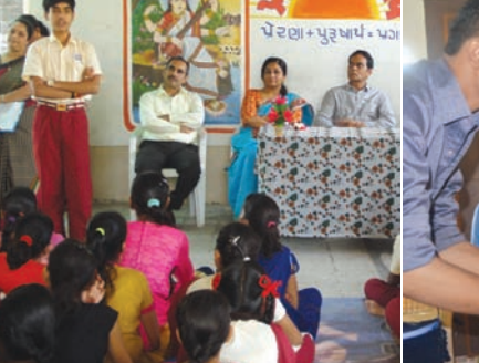
અંગ્રેજી માધ્યમના વિદ્યાર્થીઓ દ્વારા અલગ-અલગ સાંસ્કૃતિક કાર્યક્રમ પણ યોજવામાં આવ્યા હતા.