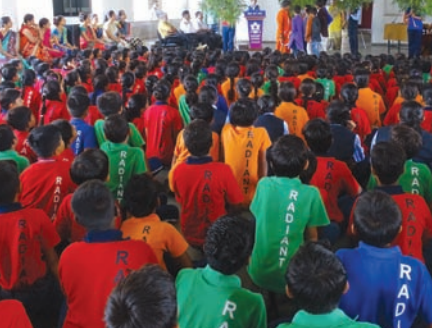
સંગીત મઠ્યો ડાન્સ પણ પ્રસ્તુત કરવામાં આવ્યો હતો.