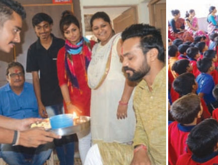
વિધિવત રીતે પૂજન નગરના યુવા કલાકારો દ્વારા કરવામાં આવ્યું હતું અને કુમકુમ તિલક કરી તેમની આરતી ઉતારવામાં આવી હતી તથા ગુરૂનું મોં પણ મીઠું કરાવવામાં આવ્યું હતું.