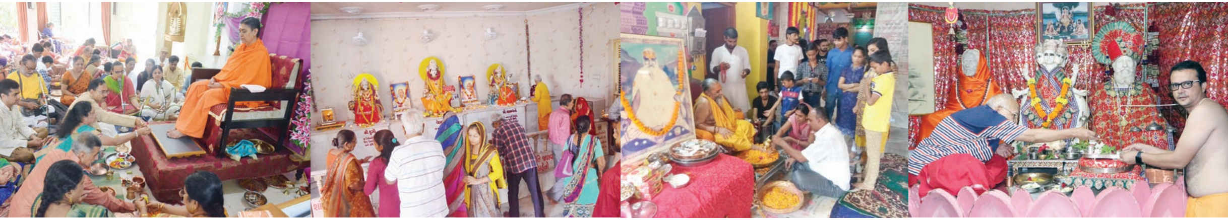
ગુરૂ દેવો ભવઃ - ગુરૂપૂર્ણિમાના પાવન પર્વે સૌ-સૌના ગુરૂના પૂજન-અર્ચન અને દર્શન કરી આશીર્વાદ મેળવ્યા હતા... શહેરમાં વહેલી સવારથી મંદિરો અને આશ્રમોમાં ભાવિકોએ ભાવપૂર્વક ગુરૂના દર્શન-પૂજન કર્યા હતા... સમગ્ર શહેર ભક્તિમય માહોલમાં ઓતપ્રોત બન્યું હતું... ભજન-ધૂન, પ્રવચન અને મહાપ્રસાદના કાર્યક્રમો યોજાયા હતા... ભારતીય સંસ્કૃતિમાં ગુરૂ-શિષ્યની ચાલી આવતી પરંપરા અનુસાર ગુરૂપૂર્ણિમાના પાવન પર્વે ગુરૂના આશીર્વાદનો મહિમા મોટો છે...