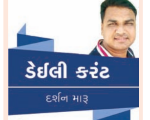
કેશ્વલી કરંટ દર્શન માસ્