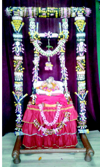
શહેરમાં હિંડોળા પર્વ ભારે હર્ષોલ્લાસથી ઉજવાઈ રહ્યું છે ત્યારે હિંડોળા શણગારમાં નાવિન્યતા એ પર્વની ખાસ વિશેષતા છે. શહેરના સુપ્રસિદ્ધ પંચેદવ મંદિર ખાતે ચોકલેટસના હિંડોળા તૈયાર કરાયા હતા જે યુવા તથા બાળ દર્શનાર્થીઓમાં ખૂબ લોકપ્રિય થવા પામ્યા હતા.

સેક્ટરમાં ખળભળાટ મચી જવા પામ્યો હતો. વિદ્યાર્થી કોલેજ થી ગાંધીનગર રોજ અપડાઉન કરતો હતો. ત્યારે આ વિદ્યાર્થીનું સેમેસ્ટર-૨ પ નું રિઝલ્ટ ટુંકમાં જ આવવાની તૈયારી છે. ત્યારે યુવકે અભ્યાસકીય દબાણમાં આ પ્રકારનું પગલુ ભર્યું હોવાનો ગણગણાટ પણ પ્રવર્ત્યો છે. બનાવ અંગે સેક્ટર-૨ ૧ પોલીસે ગુનો નોંધી વધુ તપાસ હાથ ધરી છે.