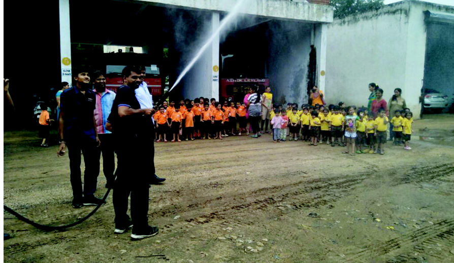
આજના યુગમાં બાળકોને પાયાના શિક્ષણથી બહેર સેવાઓ અંગે અવગત કરાવવાનું સવલ વલ્યું છે. જેનો ઉદ્દેશ અણધારી આફતના સમયે બાળકો આ સેવાઓના ઉપયોગ થકી બચાવ કાર્ય કરી શકે. શહેરના ફાયર સ્ટેશન ખાતે રંગોલી ઈવન્ટનેશનલના ભૂલકાંઓને ફાયરફ્રિગેડની કામગીરીનું તથા તે માટેના સાધનોનું પ્રત્યક્ષ નિદર્શન કરાવવામાં આવ્યું હતું.

ગાંધીનગર, તા. ૧૭ શ્રી સમસ્ત બ્રહ્મ સમાજ ગાંધીનગર દ્વારા સંચાલિત સોમનાથ મંદિરમાં શ્રાવણ માસ દરમિયાન વિવિધ ધાર્મિક કાર્યક્રમોનું આયોજન કરવામાં આવ્યું છે. જેમાં તા. ૨૪-૭-૧૭ થી ૨૧-૮-૧૭ પવિત્ર માસ દરમિયાન સવારે ૭ થી ૯.૩૦ કલાક સુધી ભિલિપત્ર યજ્ઞવવાના અને પૂજા, શ્રાવણમાસના પાંચ સોમવારે ફુલોના શણગાર, મહાઆરતી અને પ્રસાદ વિતરણ, અમાસના દિવસે લઘુરુદ્રનું આયોજન કરવામાં આવ્યું છે. આ વિવિધ ધાર્મિક કાર્યક્રમનો સૌ ભાવિક ભક્તોએ લાભ લેવા સોમનાથ મહાદેવ સમિતિ દ્વારા અનુરોધ કરાયો છે.