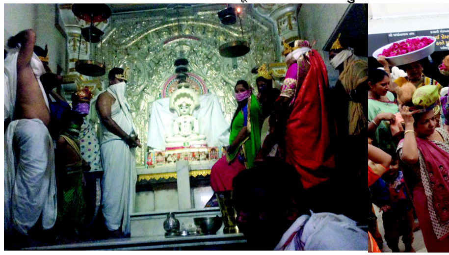
મહાઅભિષેક - જૈન દેરાસર ખાતે શાંતિધારા શકસ્તવ મહાઅભિષેક યોજાયો હતો... યાતુમાંસિના ઉપક્રમે વિવિધ ધાર્મિક કાર્યક્રમોથી દેરાસર ધમધમ્યું હતું... મહાઅભિષેકમાં મોટી સંખ્યામાં શ્રાવકો જોડાયા હતા...

ગાંધીનગર તા ૧૭ શહેરમાં ડાલ ગટરો ઉભરાવાની વ્યાપક ફરિયાદો ઉભી થઈ છે. સેક્ટરોમાં ગટરોનું દુષિત પાણી ઉભરાતા રહીશો માટે નર્ગણાર ડાયકાઓ જુની ૪૦૦ કી મીનુ નેટવર્ક ધરાવતી ગટર લાઇનના મેઇનહોલની દિવાલો પણ જર્જરીત : વરસાદી દિવસોમાં સેક્ટરોમાં ઠેર ઠેર ગાબડા ગાંધીનગર તા ૧૭ શહેરમાં ડાલ ગટરો ઉભરાવાની વ્યાપક ફરિયાદો ઉભી થઈ છે. સેક્ટરોમાં ગટરોનું દુષિત પાણી ઉભરાતા રહીશો માટે નર્ગણાર ડાયકાઓ જુની ૪૦૦ કી મીનુ નેટવર્ક ધરાવતી ગટર લાઇનના મેઇનહોલની દિવાલો પણ જર્જરીત : વરસાદી દિવસોમાં સેક્ટરોમાં ઠેર ઠેર ગાબડા ગાંધીનગર તા ૧૭ શહેરમાં ડાલ ગટરો ઉભરાવાની વ્યાપક ફરિયાદો ઉભી થઈ છે. સેક્ટરોમાં ગટરોનું દુષિત પાણી ઉભરાતા રહીશો માટે નર્ગણાર ડાયકાઓ જુની ૪૦૦ કી મીનુ નેટવર્ક ધરાવતી ગટર લાઇનના મેઇનહોલની દિવાલો પણ જર્જરીત : વરસાદી દિવસોમાં સેક્ટરોમાં ઠેર ઠેર ગાબડા