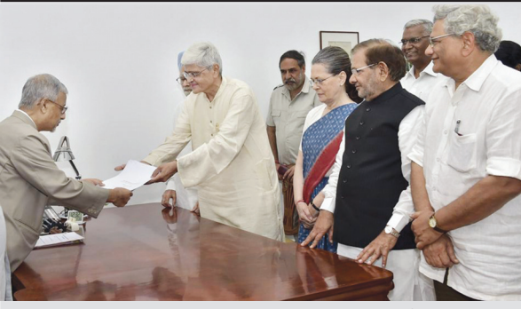
નવી દિલ્હી, તા. ૧૮ યુપીએના ઉમેદવાર ગોપાલકૃષ્ણ ગાંધીએ પણ ઉમેદવારી નોંધાવી હતી. એ વખતે કોંગ્રેસ પ્રમુખ સોનિયા ગાંધી, પાર્ટીના નાયબ અધ્યક્ષ રાહુલ ગાંધી, પૂર્વ વડાપ્રધાન મનમોહનસિંહ, જેડીયુના નેતા શરદ યાદવ,

ઉપ રાષ્ટ્રપતિપદ માટે ગોપાલકૃષ્ણ ગાંધીએ ઉમેદવારી પત્ર ભર્યું રાષ્ટ્રપતિની જેમ જ ઉપરાષ્ટ્રપતિની ચૂંટણી પદા રોમાંચક બને તેવી પ્રબળ સંભાવના