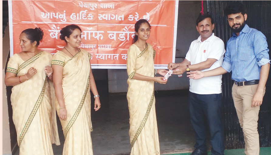
મહર્ષિ અત્રિ વિદ્યાલય ખાતે બેન્ક ઓફ બરોડા, પેશ્વર શાળા દ્વારા બેન્કના સ્થાપના દિન નિમિત્તે વિદ્યાર્થીઓને પૅન્સિલ અને ચૉકલેટનું વિતરણ કરવામાં આવ્યું હતું. આ પ્રસંગેની યાદગારી રૂપે શાળાના પ્રાંગણમાં વૃક્ષારોપણ પણ કરવામાં આવ્યું હતું.