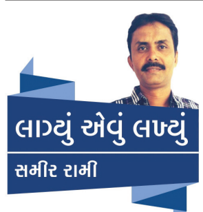
લાયઁ એવું લાયઁ સમીર રામી

વરસાદમાં ટુ વ્હીલર ચાલકોની 'રલીય' થઈ જવાના કિસ્સા પણ લગભગ તમામ ચાર રસ્તે સર્જાય છે. આમ પણ વરસાદી મોસમનું સૌથી વધુ જોખમ ટુ-વ્હીલર ચાલકોને જ ઉઠાવવું પડતું હોય છે. આપણે ત્યાં આટલા વિકાસ પછી પણ હજુ એવી ટેકનોલોજી નથી મળી શકી જેમાં વરસાદી ઝાપટામાં નવા બનાવેલા રોડ વિસ્તારમાં પાણીના ભરાવાને ઓછો કરવા કોઈ પણ જાતના જોખમસૂચક બોર્ડ કે આડશોભાગવા વગર જ ગટર ચેમ્બરના ઢાંકણા ખોલી નાંખવા તે જે તે વિસ્તારના હરખપદુડાઓનો મુખ્ય શોખ હોય છે પરંતુ આ ખુલ્લી ગટરો ગમે ત્યારે ચાલતા જતા રાહદારી કે ટુ વ્હીલર ચાલક માટે મોતના કુવા સમાન સાબિત થતી હોય છે.