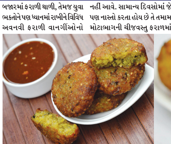
ખજાનો આવી ગયો છે. જેમાં શિવભક્તોને ભુખ્યા રહેવાનો વારો

ખમણ, થેપલા, ભાખરી, પીઝા, પફ, અને સેન્ડવીચ ની સાથો સાથ ફરાળી ફિક્સ થાળીનો પણ સમાવેશ થાય છે. જેમાં થેપલા, સુકીભાજી, રતાળુ રોલ, રસગુલ્લા, ખીચડી, દહી આપવામાં આવશે. શહેરના સ્વાદના શોખીન ભક્તો માટે તમામ વાનગીઓમાં ડીશ પ્રમાણે રૂ.૩૦ થી રૂ.૬૦ અને એક ૧ કિલો. રૂ. ૨૦૦ થી ૨૫૦ સુધીમાં બજારમાં સરળતાથી મળી રહેશે. ગાંધીનગર શહેરના શિવભક્તો માટે વેપારીઓએ અનોખી વિવિધ ફરાળી વાનગીઓ તૈયાર કરીને રાખી છે. સ્વાદના શોખીન ચટુકડા નગરજનો માટે હવે