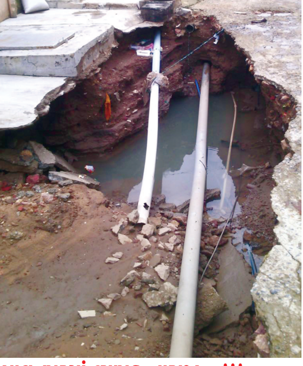
પાલનપુરમાં વ્યાપક તારાજી...!!!