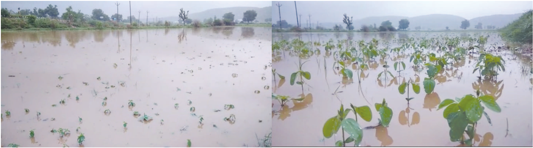
સહીત શામળાજી પંથકમાં કાળા ડિબાંગ વાદળો ધસી વાદળોની ગર્જના સાથે માર્ગો પરથી ઘૂંટણિયાસમું આંત્રોલીમાં ગુમ યુવતીને શોધવાનું કહેતા હૂમલો

સુપ્રસિદ્ધ યાત્રાધામ શામળાજીમાં મેઘરાજા કોપાયમાન થયા હોય તેમ ગુરુવારે સાંજના સુમારે કડાકા ભડાકા સાથે વીજળીના ચમકારા વચ્ચે ધોધમાર વરસાદ થતા ઠેર ઠેર પાણી ભરાયા હતા. ખેતરોમાં પાણી ભરાતા ભૂમિપુત્રોનો પાક નિષ્ફળ જવાની ભીતિ સેવાતા ખેડૂતો ચિંતિત બન્યા હતા. મેઘરાજાની પધરામણીથી વાતાવરણમાં ઠંડક પ્રસરી હતી. મોડાસા શહેર સહીત જિલ્લાના કેટલાક વિસ્તારોમાં મોડી રાત્રે વરસાદી ઝાપટા પડતા અસહ્ય ઉકળાટ અને બફારાથી લોકોને આંશિક રાહત અનુભવી હતી. શુક્રવારે સમગ્ર જિલ્લો કોરો