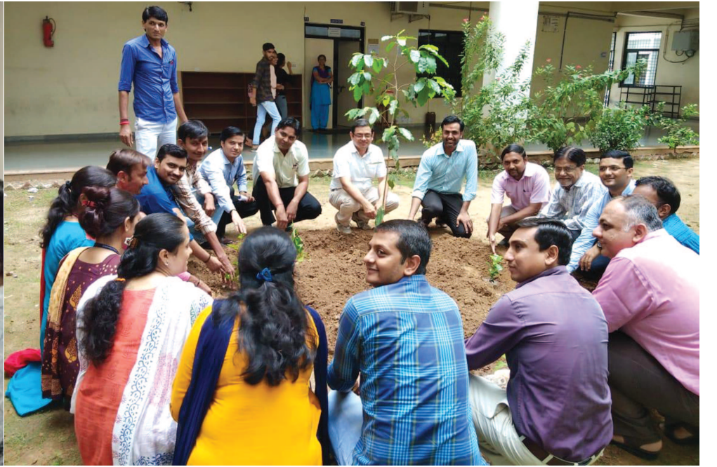
સ્મૃતિ-ચિહ્ન અને પુસ્તક ભેટમાં આપ્યું હતું અને ઉજ્જવળ કારકીર્દી માટેની શુભેચ્છાઓ પાઠવી હતી. આ પ્રસંગે ૧૦૦ થી વધુ વધુ છેલ્લા સેમેસ્ટરના વિદ્યાર્થીઓ અને વિવિધ વિદ્યાશાખાના વડાઓ હાજર રહ્યા હતા. આ પ્રસંગને યાદગાર બનાવવા માટે ફેકલ્ટી દ્વારા પરિસરમાં વૃક્ષારોપણ પણ કરવામાં આવ્યું હતું.