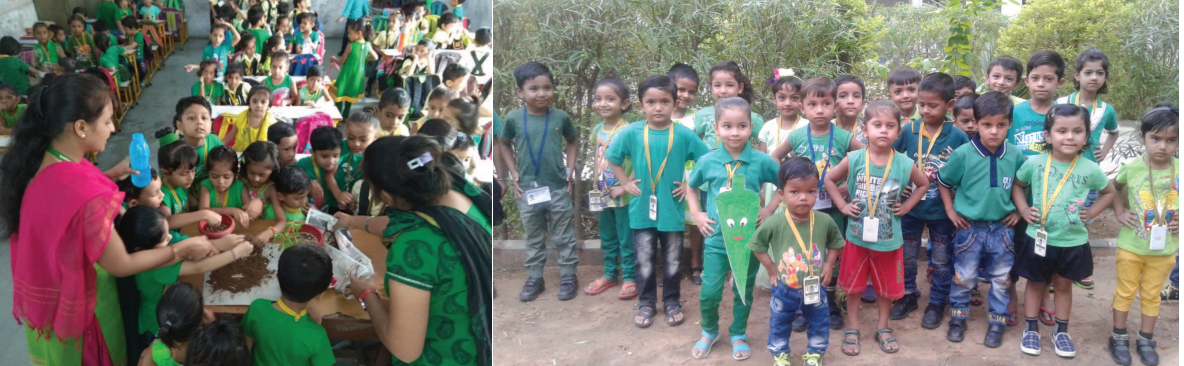
એસ. કે. પટેલ શાળામાં બાળકોને ગ્રીન કલરથી માહિતગાર કરવાના હેતુસર શનિવારે 'ગ્રીન ડે'ની ઉજવણી કરવામાં આવી હતી. વાલીઓએ બાળકોને ગ્રીન કલરનાં વસ્ત્રો પરિધાન કરવી સ્કૂલબેગ, વોટરબેગ પણ ગ્રીન કલરની મોકલવી હતી. શિક્ષિકાઓએ બાળકોને ગ્રીન કલરના વિવિધ શેડ વિષે જાણકારી આપી હતી અને વૃક્ષારોપણ કાર્યક્રમ યોજીને બાળકોને વૃક્ષો ઉગાડવા અને તેનું જતન કરવા માટે શપથ લેવડાવ્યા હતા. બાળકોને 'લીક સ્ટીકિંગ' અને 'મેજિક પેઈન્ટિંગ' જેવી પ્રવૃત્તિ પણ કરાવવામાં આવી હતી. બાળકોની સાથે-સાથે શાળા પરિવારે પણ ગ્રીન કલરનાં વસ્ત્રો પરિધાન કરીને આ કાર્યક્રમમાં સમાવિષ્ટ ઉત્સાહને બેવડાવ્યો હતો.