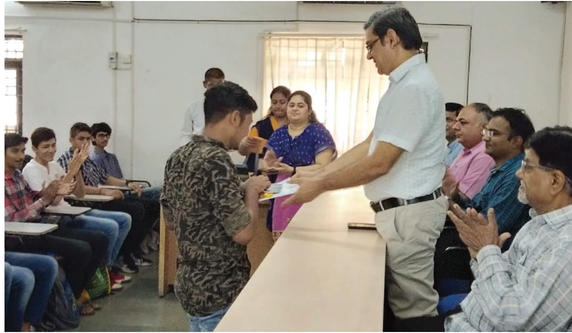
શહેરના સેક્ટર-૧૫ ખાતે સ્થિત વીપીએમપી પોલીટેકનીકમાં તા. ૦૯/૦૭/૨૦૧૮ના રોજ જીટીયુ દ્વારા મે-જીન માસમાં લેવાયેલ છેલ્લા સેમેસ્ટરની પરીક્ષામાં ૧૦ માંથી ૧૦ અને ૮ કરતા વધુ એસ.પી.આઈ. મેળવનાર તેજસ્વી વિદ્યાર્થીઓનો સન્માન સમારંભ યોજાયો હતો. આ પ્રસંગે કોલેજના પ્રિન્સિપાલ ડૉ. એ. જે. પટેલે વિદ્યાર્થીઓને પ્રમાણપત્ર,