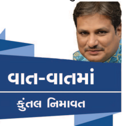
વાત-વાતમાં કુંતલ નિમાવત નહોતા ઘટાડ્યા. આ જ લોકો રાજ