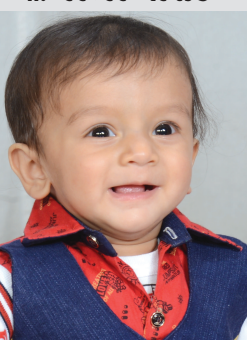
ઝઘાંત વિશાલ રાજદીપ જન્મદિને વધામણી વિભાગ અંતર્ગત કોઈપણ વાચક પોતાની તસવીરો પ્રકાશન માટે મોકલ શકે છે. પરંતુ, વાચકોને વિનંતી છે કે મોડામાં મોડી આ તસવીરો જન્મદિવસ હોય તેના અગાઉ ટિવર એક વાગ્યા સુધીમાં અખબારને મળી જાય. - સંપાદક