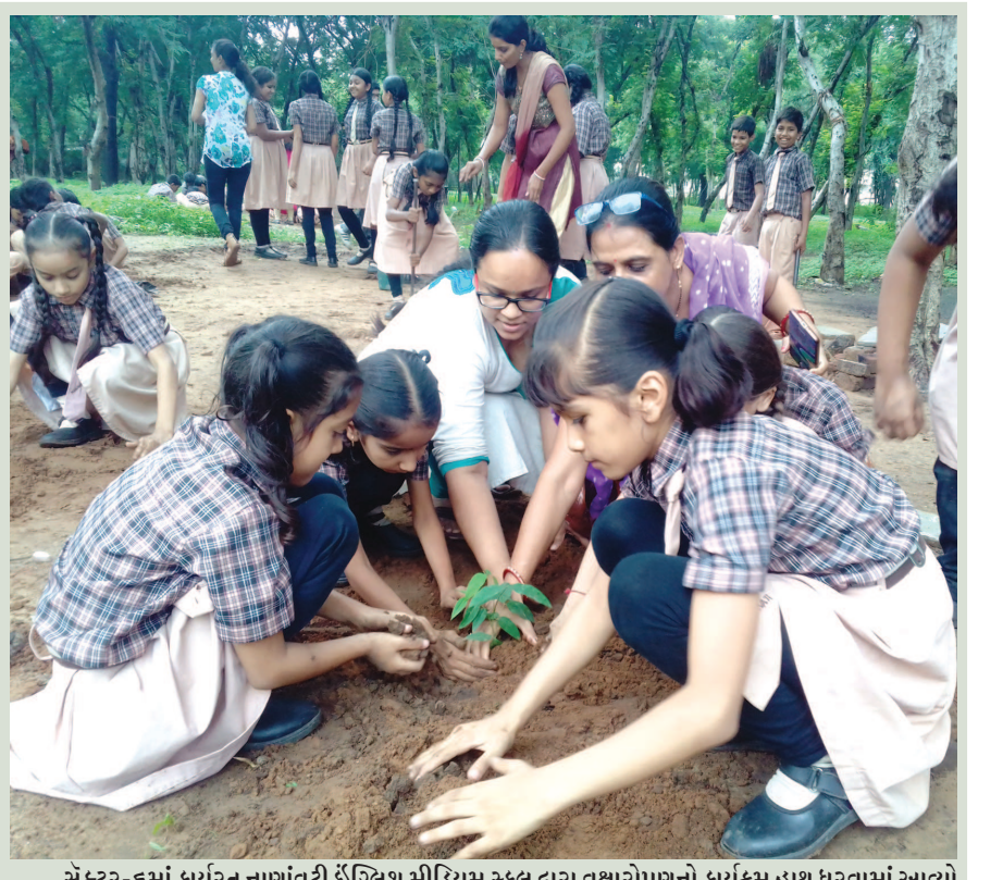
સેક્ટર-૬માં કાર્યરત નાણાંવટી ઈંગ્લિશ મીડિયમ સ્કૂલ દ્વારા વૃક્ષારોપણનો કાર્યક્રમ હાથ ધરવામાં આવ્યો હતો. સ્કૂલની આસપાસના વિસ્તારમાં વિદ્યાર્થીઓએ હોશિહોશી વૃક્ષારોપણ કર્યું હતું. વિદ્યાર્થીઓના ઉત્સાહને વધારવા માટે આ ઉમદા કાર્યમાં શિક્ષકોએ પણ સતત તેમની સાથે રહી સ્વહસ્તે વૃક્ષારોપણ કર્યું હતું.