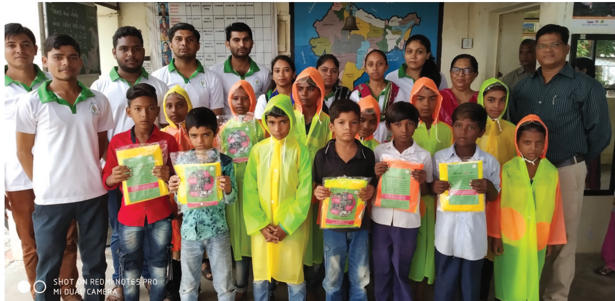
સાબરમતી સમૃદ્ધિ સેવા સંઘ સંચાલિત ગાંધીનગર ચાઈલ્ડલાઈન ૧૦૯૮, જે જરૂરિયાતમંદ બાળકો માટેની આપાતકાલીન સેવા છે તેના દ્વારા જરૂરિયાતમંદ વિદ્યાર્થીઓને દાતાઓ પાસેથી પ્રાપ્ત કરવામાં આવેલા રેઈનકોટનું વિતરણ સરકારી શાળાઓ ખાતે કરવામાં આવ્યું હતું.