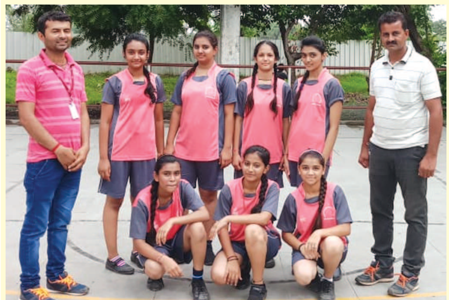
ગાંધીનગર જિલ્લા ગ્રામીણ બાસ્કેટ બોલ સ્પર્ધાનું આયોજન ગાંધીનગર ઈન્ટરનેશનલ પબ્લિક સ્કૂલ ખાતે કરવામાં આવ્યું હતું. આ બે દિવસીય સ્પર્ધામાં જિલ્લાનાં વિવિધ ગામોની શાળાઓએ ભાગ લીધો હતો અને સફળ આયોજન બદલ જીઆઈપીએસને બિરદાવી હતી.