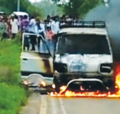
ફિટેડ વાહનોનો ઉપયોગ સ્કૂલ વાન તરીકે વાહનચાલકો ઉપયોગ કરી રહ્યા છે. સીએનજ

ગેસ ધરાવતા વાહનો જીવતા બોમ્બ સમાન હોય તેમ અને કવાર જીલ્લામાં ચાલુ વાહને સળગી ઉઠવાની ઘટનાઓ સામે આવી રહી છે. કેટલાક વાહનચાલકો હલકી ગુણવત્તા વાળી સીએનજ ક્રીટ વાહનોમાં લગાવી વાહનો હંકારી લોકોના જીવ જોખમ મૂકી રહ્યા છે. સ્કૂલવાનમાં ૨૫ થી ૩૦ બાળકો ઘેટાં બકરાની જેમ ભરી જોખમી સવારી કરાવતા ઠેર ઠેર નજરે ચઢતા હોય છે. બાયડ તાલુકાના દેરોલી ગામ નજીક બાળકોથી ભરેલ સીએનજ સ્કૂલવાનમાં અગ્ન્યકારણોસર આગ ભભૂકી ઉઠતા વાનના ડ્રાઈવરે સમયસૂચકતા વાપરી કાર રોડ પર ઉભી રાખી દઈ તમામ બાળકોને નીચે ઉતારી દેતા જાનહાની ટળી હતી. કાર ભડભડ સળગી ઉઠતા અકાંટક ડી મચી હતી. ગામલોકો દોડી આવ્યા હતા પણ કારમાં લાગેલી ભીષણ આગથી કાર સ્વાહા થઈ ગઈ હતી.