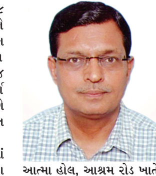
આત્મા હોલ, આશ્રમ રોડ ખાતે યોજવામાં આવી છે, જેમાં કવિ ડર્ષ બ્રહ્મભટ્ટ પોતાના જીવન-કવન વિશે વાત કરશે અને પોતાની ગુજરાતી તથા ઉર્દૂ કવિતાઓનો પાઠ કરશે.

કવિ ડર્ષ બ્રહ્મભટ્ટ પોતાના જીવન-કવન વિશે વાત કરશે અને પોતાની ગુજરાતી તથા ઉર્દૂ કવિતાઓનો પાઠ કરશે