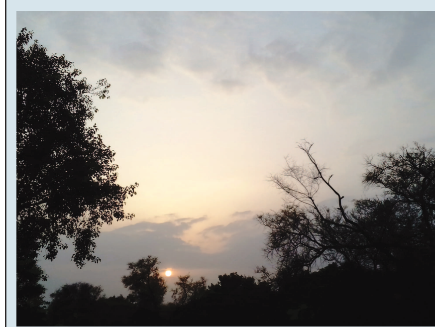
સુંદર સંધ્યા - નગરના પ્રાકૃતિક વૈભવનો પાવન નજારો એટલે અલૌકિક સંધ્યા... વૃક્ષો મંદ-મંદ પવનની લહેરવળે વહેવારવાની સાથે વાદળોની આવન-જાવન વચ્ચે સૂર્યનો અસ્ત અલૌકિક દૃશ્યનું નિર્માણ કરે છે... આબુના સનસેટ કે કે દરિયા કિનારે સૂર્યાસ્તના નજારાને પણ ભૂલાવે એવું અદ્ભૂત દૃશ્ય પાટનગરના પાદરે સર્જાય છે...

ઘરની ફર્શમાં મોટેક ટાઈલ્સના વપરાશની વિગતો ચકાસીએ તો ગુજરાતની સરખામણીએ ગાંધીનગર મોટેક ટાઈલ્સના વપરાશ/ઉપયોગમાં પાછળ છે એમ જોઈ શકાય છે. ગુજરાતના ગ્રામીણ ક્ષેત્રના આંકડા દર્શાવે છે કે ૧૬ રહેણાંકોમાં અને શહેરી ક્ષેત્રમાં ૬૦ ટકા મોટેક ટાઈલ્સ વપરાય છે. પરંતુ ગાંધીનગરની વાત કરીએ તો ગ્રામીણ વિસ્તારમાં ૧૩ ટકા અને શહેરી વિસ્તારમાં ૫૪ ટકા રહેણાંકમાં મોટેક ટાઈલ્સનો ઉપયોગ થાય છે. ગાંધીનગરથી તદ્દન નજીકમાં જ ગોતા (એસ.જી. હાઈવે) ટાઈલ્સ અને સેનેટરી સાધનો માટેનું બહુ મોટું બજાર હોવા છતાં અને ગાંધીનગરની નજીકના જ હિંમતનગરમાં છેલ્લા થોડા સમયથી ટાઈલ્સની અનેક ફેક્ટરીઓ ઉભી થઈ હોવા છતાં ગાંધીનગરમાં 'મોટેક ટાઈલ્સ' ફર્શમાં જડાવવા માટે ઉત્કૃષ્ટ જણાતા નથી. મજાની વાત એવી પણ કહી શકાય કે ગાંધીનગરના રહેણાંકમાં ઘરની ફર્શ મોટેક ટાઈલ્સની હોવાનું પ્રમાણ ઓછું છે પરંતુ ગાંધીનગરના શહેરી વિસ્તારમાં રાહતદરના