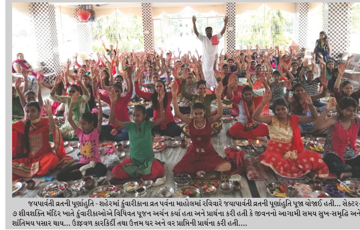
જયપાર્વતી ત્રતની પૂર્ણાહુતિ - શહેરમાં કુંવારીકાના ત્રત પર્વના માહોલમાં રવિવારે જયાપાર્વતી ત્રતની પૂર્ણાહુતિ પૂજા યોજાઈ હતી... સેક્ટર-૭ શીવશક્તિ મંદિર ખાતે કુંવારીકાઓએ વિધિવત પૂજન અર્ચન કર્યા હતા અને પ્રાર્થના કરી હતી કે જીવનનો આગામી સમય સુખ-સમૃદ્ધિ અને શાંતિમય પસાર થાય... ઉજવણ કારકિર્દી તથા ઉત્તમ ઘર અને વર પ્રાપ્તિની પ્રાર્થના કરી હતી...