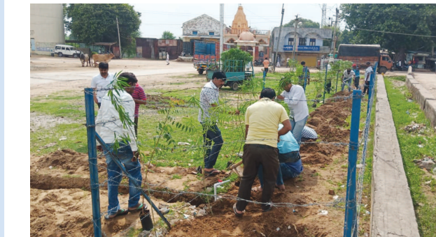
ઉનાવા યુથ ક્લબ દ્વારા ઉનાવા પંચાયત અને તળાવની નજીક ૧૦૦ જેટલા લીમડાના છોડનું વાવેતર કરવામાં આવ્યું હતું અને દરેક સભ્યને એક એક વૃક્ષની જવાબદારી સોંપવામાં આવી હતી.