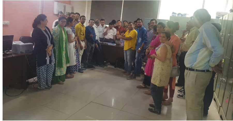
ગાંધીનગર સિવિલ ખાતે હાલ વર્ષ ૨૦૧૯-૨૦ના મેડિકલ કોર્ષના એડમિશનની પ્રક્રિયા ચાલી રહી છે. જેમાં સંપૂર્ણ સ્ટાફ ખરે પગે વિદ્યાર્થીઓને મદદ અર્થે કાર્યરત છે.