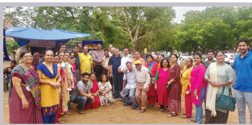
લાયન્સ ક્લબ દ્વારા રથયાત્રા દરમિયાન લગભગ ૯ હજાર જેટલા રોપાનું શહેરીજનોને વિતરણ કરવામાં આવ્યું હતું.