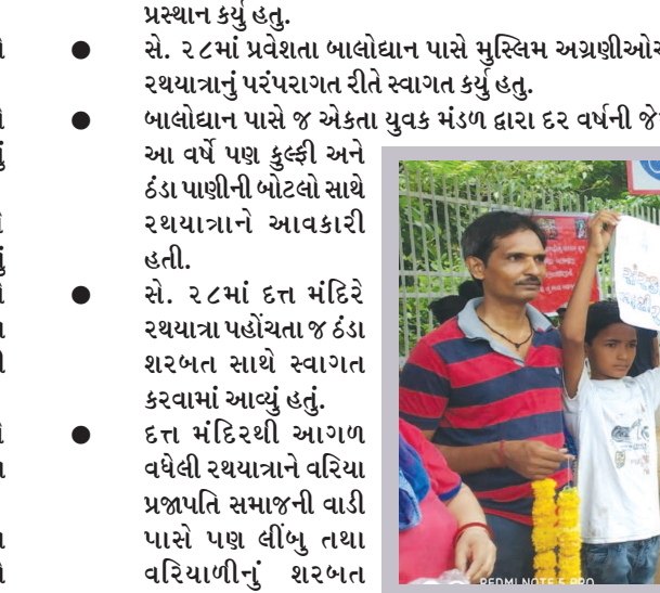
સે. ૨૭માં ગોપાલ સ્વીટમાર્ટ પાસે શહેર કોંગ્રેસ અગ્રણીઓએ સ્વાગત કર્યું હતું.