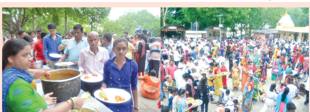
જલારામ મંદિર સે-૨૮ દ્વારા રથયાત્રાનું ભવ્ય સ્વાગત કરી ભગવાન જગન્નાથજીનું મોસાળુ કરવામાં આવ્યું હતું. શહેરના લગભગ ૮ હજાર જેટલા ભાવિકોએ જલારામધામમાં પ્રસાદ લીધો હતો.