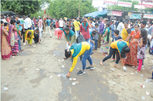
ચોધરી કોલેજની એનએસએસની વિદ્યાર્થીનીઓ દ્વારા રથયાત્રા દરમિયાન થતો કચરો ઉઠાવવાનું અભિયાન શરૂ કરવામાં આવ્યું હતું.

અને ચેવડાનું વિતરણ, ટોરેન્ટ પાવર, નાગરિક બેંક, હોટલ મેનેજમેન્ટ, હિંગોળ સાયકલ સેન્ટરમાં ભગવાનના રથમાં હવા પુરી તિરૂપતી બાલાજી મંદિર, બ્રહ્મસમાજ દ્વારા સ્વાગત અને હેપી યુથ ક્લબ દ્વારા ગાંધીયા વિતરણ.