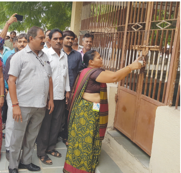
ખોરજ ગ્રામ પંચાયતની કચેરીને તાળા મારી તલાટી વિરુદ્ધ સુત્રોચ્ચાર કરવામાં આવ્યા હતા તે પ્રસંગની તસ્વીર.