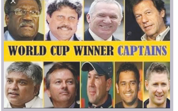
WORLD CUP WINNER CAPTAINS