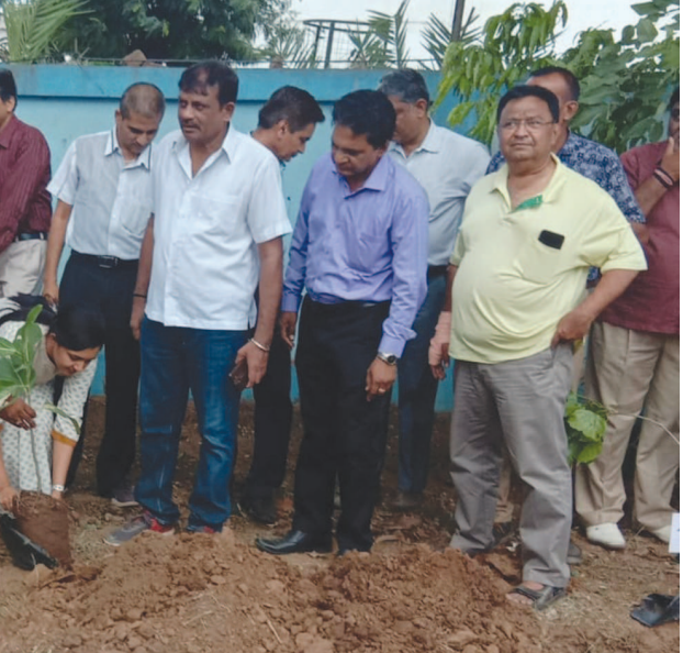
જુઆઈડીસીના ઈલેક્ટ્રોનિક્સ ઝોનમાં વૃક્ષારોપણ યોજાવું