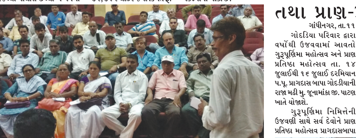
ગાંધીનગર શહેરના આંબેડકર હોલ ખાતે ગુરુવારના રોજ ગુજરાત રાજ્ય પછાત વર્ગ છાત્રાલય કર્મચારી મહામંડળના હોદ્દેદારોની બેઠક યોજાઈ હતી. જેમાં છાત્રાલયમાં ફરજ બજાવતા ગૃહપતિ, ગૃહમાતા, રસોઈયા અને ચોકીદારને ઉચ્ચક પગાર આપવામાં આવે છે. તે સરકાર દ્વારા આ કર્મચારીઓના પગારમાં વધારો કરવામાં આવે તે માટે ઉચ્ચકક્ષાએ લેખિત રજૂઆત કરાઈ છે. આ પ્રસંગે સમગ્ર ગુજરાતમાંથી મોટી સંખ્યામાં છાત્રાલયના કર્મચારીઓ હાજર રહ્યા હતા.

છ માસથી એક વર્ષ સુધી બાકી પકડવાના ૩૬ અને એક વર્ષથી વધુ સમયથી બાકી પકડવાના ૭૦ આરોપીઓ હજુ પકડાયા નથી ગાંધીનગર, તા. ૧૧ ગાંધીના ગુજરાતમાં દારૂબંધી માત્ર કાગળ પર છે. રાજ્યના શહેરોમાં જોઈએ તેટલો દારૂ છુટથી મળી રહે છે. ત્યારે ગાંધીનગર જિલ્લામાં છેલ્લા બે વર્ષમાં એટલે કે તા. ૧ જુન ૨૦૧૭ થી તા. ૩૧ મે ૨૦૧૮ વચ્ચે ૩,૧૦,૫૦ કોડેશી વધુનો વિદેશી અને દેશી દારૂ પોલીસ તંત્ર દ્વારા પકડવામાં આવ્યો છે. એટલે કે સરેરાશ પર નજર કરી એ તો રોજનો ૧.૪૩ લાખ રૂપિયાનો દારૂ જિલ્લામાં પકડાયો છે. ત્યારે જિલ્લા પોલીસે છેલ્લા બે વર્ષમાં દેશી અને વિદેશી દારૂના કુલ ૪,૦૫૩ કેસ કર્યા છે. ત્યારે આ આંકડાકીય માહિતી વિધાનસભા દરમિયાન માણસાના ધારાસભ્ય સુરેશ પટેલે પુછવા પ્રશ્નમાં મુખ્યમંત્રીએ આપેલા જવાબમાં સામે આવી છે. ગાંધીનગર જિલ્લા પોલીસે છેલ્લા બે વર્ષમાં વિદેશી દારૂની બોટલ નંગ-૩, ૨૦,૦૪૭, જેની કિંમત રૂ. ૮,૮૮,૪૧,૬૭૮ બિયર બોટલ નંગ-૪૪,૮૭૫ જેની કિંમત રૂ. ૪૫,૦૭,૫૪૨ થાય છે. જ્યારે દેશીદારૂ ૩૨,૩૧૨ લીટર જેની કિંમત રૂ. ૬,૪૬,૨૪૦ થાય છે. જ્યારે તા. ૧ જુનથી ૨૦૧૭ થી ૩૧ મે ૨૦૧૮ દરમિયાન દેશીદારૂના ૩૩૦૩ કેસ નોંધાયા છે. તે બે વર્ષમાં કુલ કેસમાં ૬૩૮૬ દારૂડીયાઓની ધરપકડ કરવામાં આવી છે. જ્યારે ૧૫૦ આરોપીઓને હજુ પણ પકડવાના બાકી છે. જેમાં છ માસથી એક વર્ષ સુધીના ૩૬ આરોપીઓને પકડવાના બાકી છે. તે એક વર્ષથી વધુ સમય સુધી ન પકડાયેલા ૭૦ થી વધુ આરોપી પકડવાના બાકી છે.