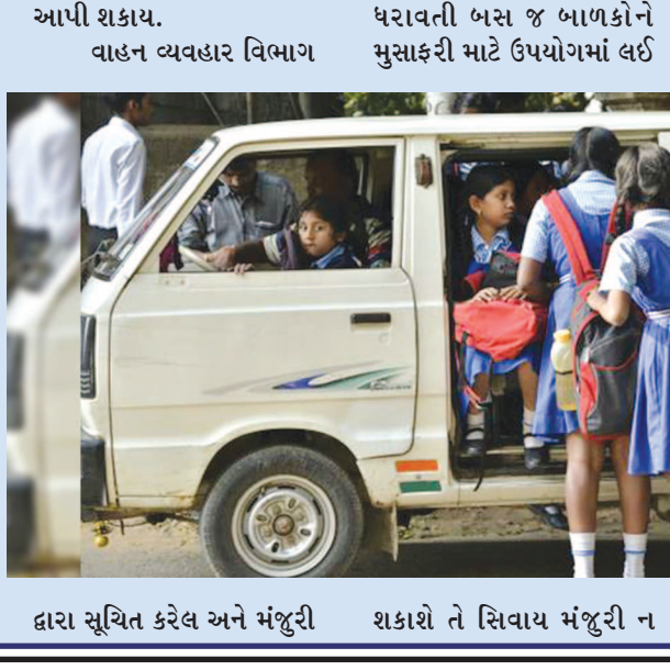
દ્વારા સૂચિત કરેલ અને મંજૂરી શકાશે તે સિવાય મંજૂરી ન નહિ.

ગાંધીનગર, તા. ૧૨ હાલમાં જ ફાયર સેફ્ટી ધ્યાનમાં લઈ શહેરની દરેક શાળા, કોલેજ, પ્રાઈવેટ ટ્યુશન ક્લાસીસ, જાહેર બિલ્ડીંગ જેવી જગ્યાઓ પર ફાયર સેફ્ટીની નોંધ લેવાઈ છે ત્યારે રાજ્ય વાહન વ્યવહાર વિભાગ દ્વારા પણ રાજ્યમાં સ્કૂલ વાહન કે રીક્ષાની ઘટનાઓને ધ્યાનમાં લઈ માર્ગ સલામતી માટે જરૂરી સુચનાઓ બહાર પાડવામાં આવી છે. રાજ્ય વાહન વ્યવહાર વિભાગ મુજબ સ્કૂલ વર્ષોમાં જતી બસનો રંગ પીળો હોવો જોઈએ અને બસની આગળ અને પાછળના ભાગે સ્કૂલનું નામ મોટા અક્ષરે લખેલું હોવું જોઈએ. ડ્રાઈવરની માહિતી અને શાળાનો નંબર બસની અંદર કે બહારની તરફ સ્પષ્ટ પણે લખાયેલો હોવો જોઈએ. બસની બારીઓ પર આડી પટ્ટી કે જાળી હોવી જોઈએ. બસમાં પડદા કે કાચ પર ફિલ્મ લગાવેલી ન હોવી જોઈએ. ગતિ મર્યાદા ૪૦ કિમી પ્રતિ કલાકની હોવી જોઈએ. સ્કૂલબસની અંદર જીપીએસ અને સીસીટીવીની વ્યવસ્થા હોવી જોઈએ અને સ્કૂલબસમાં એલામ કે મોટા અવાજવાળું ધ્વનિ સંકેતનું સાધન હોવું જોઈએ જેથી આપત્તિના સમયે ચેતવણી આપી શકાય.