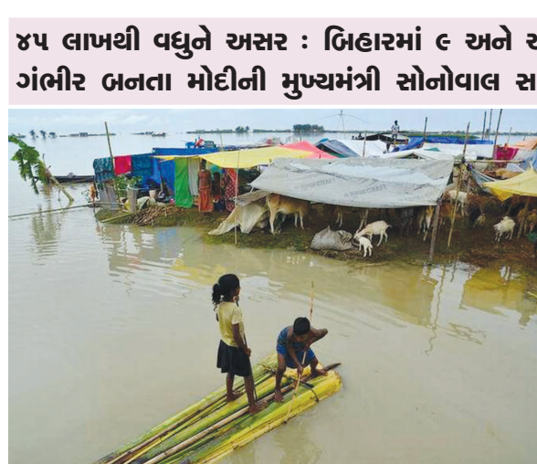
૪૫ લાખથી વધુને અસર : બિહારમાં ૯ અને આસામમાં ૩૧ જિલ્લાઓ સર્કજમાં આવ્યા : આસામમાં પુરની પરિસ્થિતિ વધુ ગંભીર બનતા મોટીની મુખ્યમંત્રી સોનોવાલ સાથે વાતચીત : મેઘાલય, ત્રિપુરા, ઉત્તરપ્રદેશમાં પણ હાલત કફોડી બની છે

સુપ્રીમ કોર્ટ કોંગ્રેસ અને જેડીએસના ભાગી ધારાસભ્યોની અરજ પર મંગળવારે સુનાવણી કરશે. માનવામાં આવી રહ્યું છે કે, સુપ્રીમ કોર્ટ આજ દિવસે પોતાનો નિર્ણય સંભળાવી શકે છે. તેને જોતાં કોંગ્રેસે વિશ્વાસમત માટે ૧૮ જુલાઈનો સમય નક્કી કર્યો છે. તેનાથી કોંગ્રેસ-જેડીએસને એક કાયદો એ થશે કે, તેમને કુમારસ્વામીની સરકાર બનાવવા માટે વધારે સમય મળશે.