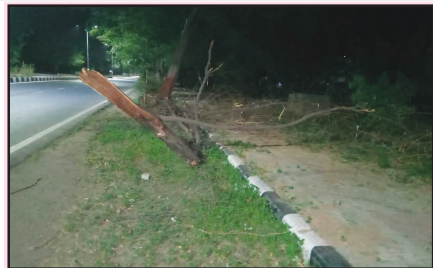
ગાંધીનગરના સેક્ટર-૪માં એપ્રોચ રોડ પરની ફુટપાથ પર છેલ્લા ૧૦થી વધુ દિવસથી એક વૃક્ષ આડું પડ્યું છે. જેને કારણે ત્યાંથી પસાર થઈ રહેલા રાહદારીઓને પરેશાનીનો ભોગ બનવું પડી રહ્યું છે. આ વૃક્ષના થડને સત્વરે ત્યાંથી ખસેડવામાં આવે તેવી સ્થાનિક રહીશોમાં માંગ ઉઠવા પામી છે.