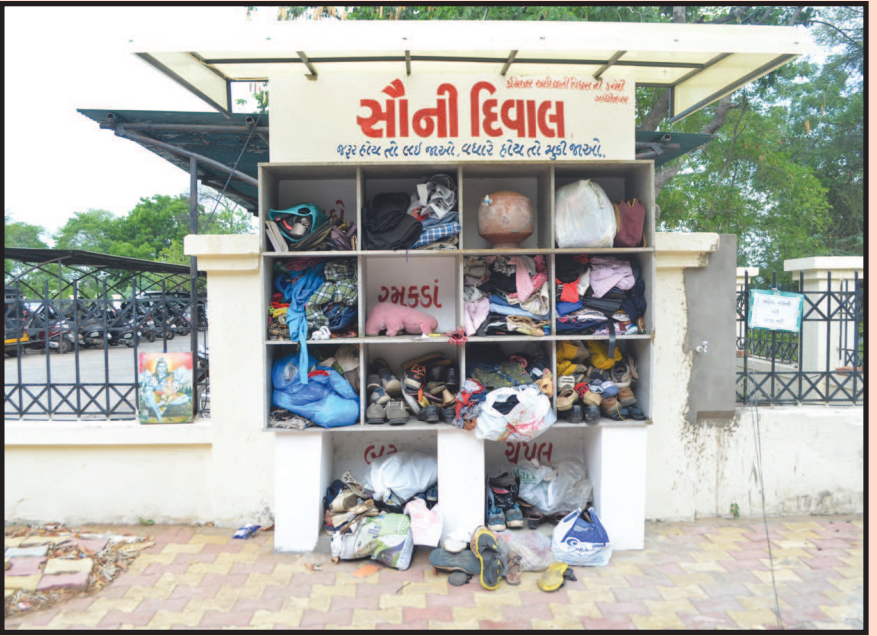
બે કે ત્રણ દિવસ પહેલા જ બિરસામુંડા ભવન ખાતે 'સોની દિવાલ' બની છે. જ્યાં સો કોઈ ચીજવસ્તુ બોક્સમાં મુકી અને લઈ જઈ શકે છે. આ દિવાલ રમકડાં, છુટ ચંપલ, માટલાં, કપડાં વગેરે વસ્તુઓથી ભરાઈ ગઈ છે અને તે જરૂરીયાતમંદ ક્યારે લઈ જાય તેની રાહ જોઈ રહી છે.