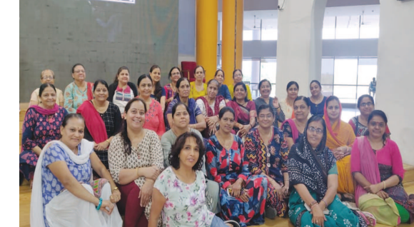
કૌશલ્યા ગ્રુપ ગોલ્ડન વીંગની ૪૦થી પણ વધુ મહિલાઓએ આજે રાજ્ય વિધાનસભા ગૃહની મુલાકાત લીધી હતી. આ મહિલાઓની સમૂહ તસ્વીર.