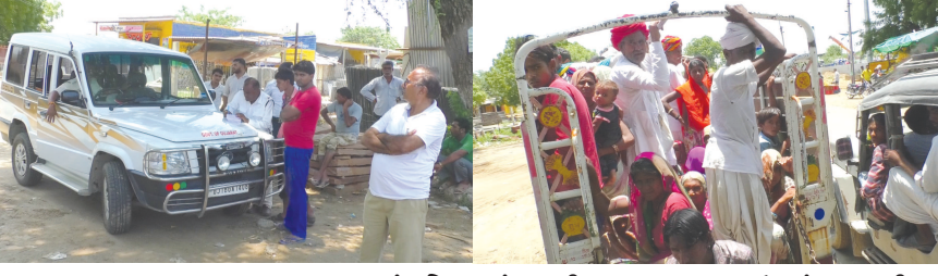
પાલનપુર, તા. ૨૩ બનાસકાંઠા જિલ્લા ના ધાનેરા માં એસટી વિભાગ દ્વારા બેફામ અને ઘેટાં બકરા ની જેમ ભરીને ચાલતા લકઝરી અને લોડિંગ વાહન ચાલકો સામે કાયદેસર ની કાર્યવાહી કરવાના બદલે તેમને છાવરી રહ્યા છે અને જે ગરીબ લોકો નાની જીપમાં પેસેનેજર ભરીને પોતાનું ગુજરાન ચલાવે છે તેવા લોકો સામે રોફ બતાવી દંડ ફટકારી રહ્યા છે ત્યારે એસટી વિભાગની આ કામગીરી જોઈ લોકોએ આવા અધિકારીઓ સામે ફિટકાર વરસાવ્યો હતો.

બનાસકાંઠા જિલ્લામાં લકઝરી બસ અને લોડિંગ વાહનોમાં ઘેટાં બકરાની જેમ મુસાફરો બેસાડી લકઝરી ચાલકો બેફામ ચાલી રહ્યા છે અને તેમની સામે કાર્યવાહી કરવાના બદલે તેમને છાવરી રહ્યા છે અને જે નાના વાહન ચાલકો મજૂરી કરી તેમનું ગુજરાન ચલાવે છે તેની ઉપર સત્તાનો દુરુપયોગ કરી રોક જમાવે છે ત્યારે આજે આ એસટી વિભાગના કર્મચારીઓ આજે ધાનેરા વિસ્તારમાં તાપસ અર્થે આવ્યા હતા અને તાપસના નામે વાહન ચાલકો ને હેરાન કરી રહ્યા હતા તે સમયે વાહન ચાલકો દ્વારા મીડિયાને બોલાવતા મીડિયાની ટિમ પણ ત્યાં પહોંચી હતી અને ત્યાં જઈ જોયું તો આ અધિકારીઓ નાના વાહન ચાલકો ઉપર રોક જમાવી રહ્યા હતા. આ ઉપરાંત લકઝરી અને લોડિંગ ગાડીમાં ઘેટાં બકરાની જેમ પેસેનેજર ભરી ચાલકો પસાર થઈ રહ્યા છે અને આ અધિકારીઓને જાણ કરવા છતાં પણ આ અધિકારીઓ લકઝરી કે લોડિંગ વાહનો સામે કરતા અનેક તર્કવિતર્ક જોવા મળ્યા હતા તો બીજી તરફ નાના વાહન ચાલકો એ આશ્ચર્ય કરતા જણાવ્યું હતું કે મોટા વાહનવાળા એસટી વિભાગને હમા પહોંચાડે છે અને અમે નાના વાહન ચાલકો તેમને હેરાન નથી આપતા એટલે તે અમને હેરાન કરે છે ત્યારે જો આ વાત સત્ય હોય તો ખુબજ શરમજનક કહેવાય ત્યારે હવે જોવાનું એ રહે છે લગતા વળગતા અધિકારીઓ બનાસકાંઠાના એસટી વિભાગના અધિકારીઓ સામે શું પગલાં ભરે છે.