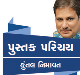
પુસ્તક પરિચય કુંતલ નિમાવત

ભજવાઈ ચૂક્યાં છે. આમ, આ પુસ્તકમાં સમાયેલાં નાટકો મંચનક્ષમતા ધરાવે છે તે સાબિત થઈ ચૂક્યું છે. લેખક વર્ષો સુધી વનખાતામાં રહ્યા છે, તેથી અહીં મોટાભાગનાં નાટકો પશુ, પંખી, પર્યાવરણસંબંધી છે. નાટ્ય સંગ્રહની પ્રસ્તાવના જાણીતા બાળનાટ્ય લેખક નટવર પટેલ દ્વારા લખાઈ છે. લેખકે આ સંગ્રહ જોઈએ, એવો ગમ્ભિર સંદેશો નાટકના માધ્યમથી આપવામાં આવ્યો છે. 'પ્રકૃતિનું બલિદાન' નાટકમાં કાળગતો વનગાડ ન કરવાની વાત કહેવાઈ છે. કાળગ વૃક્ષમાંથી બને છે, તે જાણ્યા પછી બંને બાળકો કાળગની બચત કરતાં થાય છે. આવી જ વૃક્ષો બચાવવાની વાત 'વૃક્ષો મારો વહાલો'માં કરવામાં આવી છે. 'નવજીવન' નાટકમાં પણ આ જ સંદેશો આપ્યો છે. 'હવા બચાવો' નાટક કિંવક પ્રસ્નોતરી રૂપે એક નવી ટેકનિક દ્વારા રજૂ થયું છે. અહીં લેખકે હવાનું મહત્વ શું છે તે પ્રસ્નોતરી દ્વારા સમજાવ્યું છે. 'માનવ પર મુકદમો'માં નાનાં પ્રાણીઓ વનગાડ પાસે ફરિયાદ લઈને જાય છે. માનવી પોતાની દવાઓના પ્રયોગો કરવા અન્ય સંશોધનો કરવા નાનાં પ્રાણીઓ પર જે પ્રયોગો કરે છે તે અંગેની અહીં વાત છે. તો વળી 'યંત્રમાનવ'માં બે વૈજ્ઞાનિકો વાતચીત કરે છે. એક માનવ કલ્યાનો વિશેષ કરે છે. જે વિરાટ એવો રોબોટ બનાવે છે જે 'હવે હું ચૂપ નહીં રહું' બાળનાટ્ય સંગ્રહ લેખક : નટવર હેડાઉ પ્રકાશક : પ્રણવ પ્રકાશન, અમદાવાદ પ્રથમ આવૃત્તિ, ૨૦૧૮ • કિંમત : રૂ. ૧૦૦/-