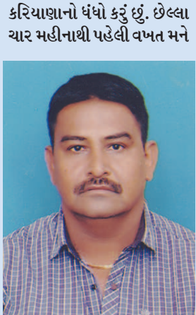
મંદીનો અનુભવ થઈ રહ્યો છે. માર્કેટમાં પૈસા જ નથી. અમે તો ચેક, મશીન, રોકડથી પૈસા લઈએ છીએ છતાં ગ્રાહક જલ્દી પૈસા ચૂકવવા તૈયાર નથી.

ગાંધીનગર, તા. ૨૫ ગાંધીનગરના બજારોમાં મંદીની અસર જોવા મળી રહી છે. નવા બજાર સિવાય કરિયાણા, કાપડ જેવા બજારમાં ગ્રાહકોની ખોટ વર્તાઈ રહી છે. રૂપિયાનું રોટેશન સ્પીડી થતું નથી. ઉઘરાણી જ નથી આવતી સાથે સાથે ગ્રાહકો ખરીદી માટે બીજા અનેક માધ્યમોનો ઉપયોગ કરી રહ્યા છે. મંદી તો છે જ પરંતુ ગ્રાહકોની ખરીદી શક્તિ પણ ઓછી થતી જણાઈ રહી છે. આ બાબતને ધ્યાનમાં લઈ શહેરના વેપારીઓનો અભિપ્રાય લેવામાં આવ્યો.