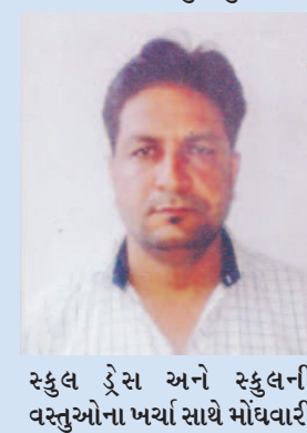
સ્કુલ ડ્રેસ અને સ્કુલના વસ્તુઓના ખર્ચા સાથે મોંઘવારી વધી છે. પગાર ઓછા છે એટલે ખરીદી પણ નથી. બજેટ પ્રમાણે ચાલતા શહેરીજનો કપડામાં પૈસા વાપરવા કરતા તેઓ પૈસા બચાવવામાં માને છે. વરસાદ નથી પડયો ગામડાના લોકોને પૈસાની કમાણી ન થઈ હોય એટલે તેઓ હાલ ખરીદી નથી કરી શકતાં. લગભગ ૫૦ ટકા ઘરાકીમાં અમારે ઘટાડો પડ્યો છે.

ભાવમાં કપડાંનું વેચાણ કરી રહ્યા છીએ એટલે અમને એટલી હદે મંદી નથી નડતી.