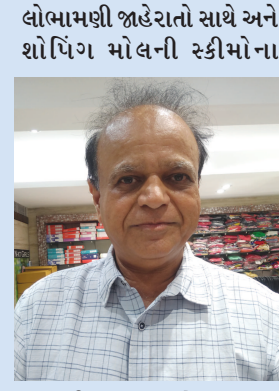
લોભામણી જાહેરાતો સાથે અને શોપિંગ મોલની સ્કીમોના આકર્ષણથી ગ્રાહકો ત્યાં વધુ આકર્ષાય છે. ફેશન અપગ્રેડ થાય છે પણ અહીં બધાનું માર્કેટ સેટ ચેન્જ નથી થતું વેપારીઓ અપગ્રેડ નથી થતા જેથી તેમને ઘરાકીમાં માર પડે છે. જો કે અમે હાલ રિઝનેબલ

કરિયાણાનો ધંધો કરું છું. છેલ્લા ચાર મહીનાથી પહેલી વખત મને ગ્રાહકની ખરીદશક્તિ ઓછી થઈ ગઈ છે. આ મહિનામાં વરસાદની અસર પણ ઘરાકીમાં વર્તાઈ રહી છે. હવે પહેલાની જેમ સેક્ટરોમાં ખરીદી કરવાનો કેલ નથી રહ્યો. નવું ગાંધીનગર ચિલોડા, રાંધેજા, પેથાપુરનો વિસ્તાર પણ વધુ ડેવલપ થતાં ત્યાંથી જ બધી વસ્તુ મળી રહેતા ગ્રાહક સ્પેશિયલ અહીં વસ્તુ લેવા પહેલાની જેમ નથી આવતો.