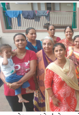
સેક્ટર-૩/એમાં મેઘરાજાને રીઝવવા માટે સેક્ટરની બહેનો એ ઘેરઘેર ફરીને દુહીયા બાપજી કાઢ્યા હતા અને વરૂણ દેવને વરસાદ વરસાવવા વિનંતી કરી હતી.

ગાંધીનગર, તા. ૨૫ ગાંધીનગરની સંસ્થા અલ્પ હુમન બીઈંગ ચેરિટેબલ ફાઉન્ડેશન દ્વારા આગામી તા. ૨૮મી જુલાઈ રવિવારના રોજ શરીદવીર દિલીપસિંહ વિરસંગભા ડોડીયાને ભાવભરી શ્રધ્ધાંજલિ પાઠવવાના કાર્યક્રમનું આયોજન કરવામાં આવ્યું છે. આ કાર્યક્રમ સે-૧૭માં ચ-૫ સર્કલ નજીક સ્ટાફ ટ્રેનીંગ કોલેજ ખાતે બપોરે ૨ થી ૫ કલાક દરમિયાન યોજવામાં આવ્યો છે.