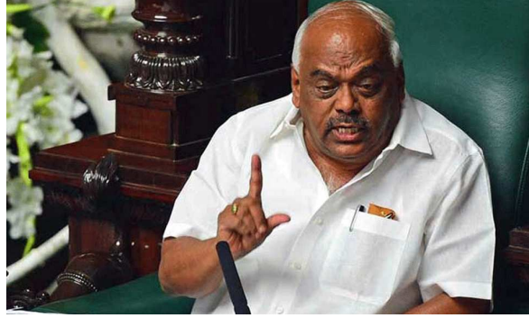
૧૭ ધારાસભ્યને અયોગ્ય કરાર આપી દેવાયા છે. સ્પીકર રમેશ કુમારના આ નિર્ણય બાદ વિધાનસભામાં ધારાસભ્યોની સંખ્યા ૨૦૭ વધી છે. એટલે કે

બેંગ્લુરુ, તા. ૨૮ કર્ણાટકમાં તમામ ૧૪ બાગી ધારાસભ્યોની સદસ્યતા રદ કરી દેવાઈ છે. સ્પીકર આર રમેશ કુમારે કોંગ્રેસના ૧૧ બાગી ધારાસભ્યો અને જેડીએસના ૩ બાગી ધારાસભ્યોની સદસ્યતા રદ કરવાનું એલાન કર્યું. નિર્ણય બાદ સ્પીકર રમેશ કુમારે કહ્યું કે હુ કોઈ ચાલાકી કે ડ્રામા નથી કરતો પરંતુ સૌમ્ય રીતે નિર્ણય લીધો છે. કર્ણાટકમાં રાજકીય ધમાસાણ વચ્ચે સોમવારે કર્ણાટક વિધાનસભામાં સીએમ બીએસ યેદિયુરપ્પા બહુમતી સાબિત કરશે.