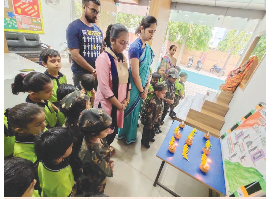
આરાધના વિદ્યાવિહાર (અંગ્રેજી માધ્યમ) દ્વારા શુક્રવારે કારગિલ વિજય દિવસની ઉજવણી કરવામાં આવી હતી. શિક્ષકોએ બાળકોને આ દિવસનું મહત્વ સમજાવ્યું હતું. નાનાં બાળકોએ દેશભક્તિ ગીત પર નૃત્યની રજૂઆત કરી હતી અને મૌન પાળીને શહીદોનો શ્રદ્ધાંજલિ પણ અર્પણ કરી હતી.