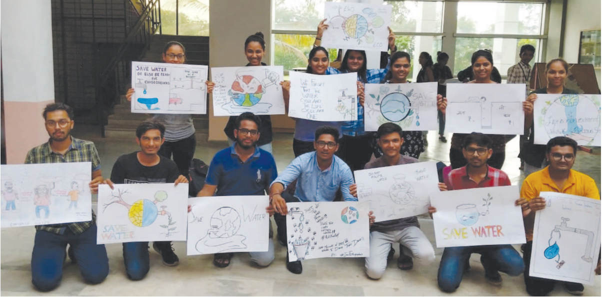
સરસ્વતી ઈન્સ્ટિટ્યુટ ઓફ ફાર્માસ્યુટિકલ સાયન્સિઝ, ધણપ દ્વારા જળ દિવસના અનુસંધાને 'જળ શક્તિ અભિયાન'ની થીમ પર ચિત્ર સ્પર્ધા યોજવામાં આવી હતી. વિદ્યાર્થીઓમાં પાણી બચાવવા પ્રત્યે જાગૃકતા આવે અને તેઓ રોજિંદા જીવનમાં પાણીનો બચાવ કરે એ માટે આ સ્પર્ધા યોજવામાં આવી હતી. ૪૦ જેટલા વિદ્યાર્થીઓ તથા પ્રોફેસરોએ ઉત્સાહભરે વિવિધ પ્રકારના ચિત્રો બનાવી પ્રદર્શન પણ યોજ્યું હતું.