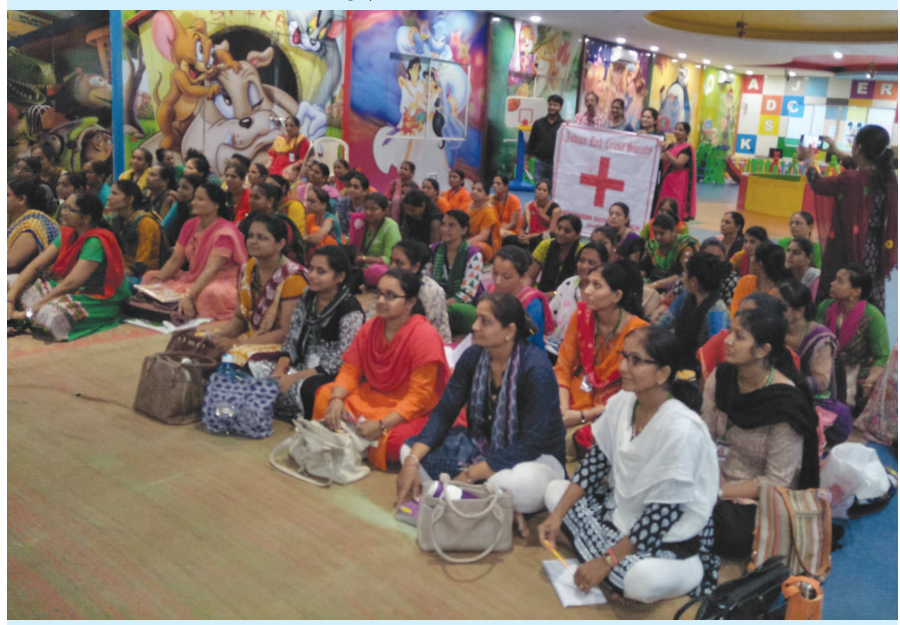
સર્વ વિદ્યાલય કેળવણી મંડળ દ્વારા સંચાલિત એસ કે પટેલ સ્કૂલમાં 'ફર્સ્ટ એઈડ' વર્ક-શોપ યોજાયો હતો, જેમાં ૭૦ જેટલા શિક્ષકોએ ભાગ લીધો હતો. રેડ ક્રોસ તરફથી આ તાલીમ આપવામાં આવી હતી. નિષ્ણાતોએ સ્કૂલમાં આકસ્મિક બનાવ બને તો શું કરવું તેના વિષેની પણ માહિતી આપી હતી. એસ કે પટેલ સ્કૂલ, એસ વી પ્રિ સ્કૂલ, એચ વી, વી એમ બાલમંદિર, ક્રિએટિવ ઝોનના આચાર્ય, શિક્ષક તથા નોન ટીચિંગ સ્ટાફ દ્વારા આ ઉપયોગી તાલીમ પ્રાપ્ત કરવામાં આવી હતી.