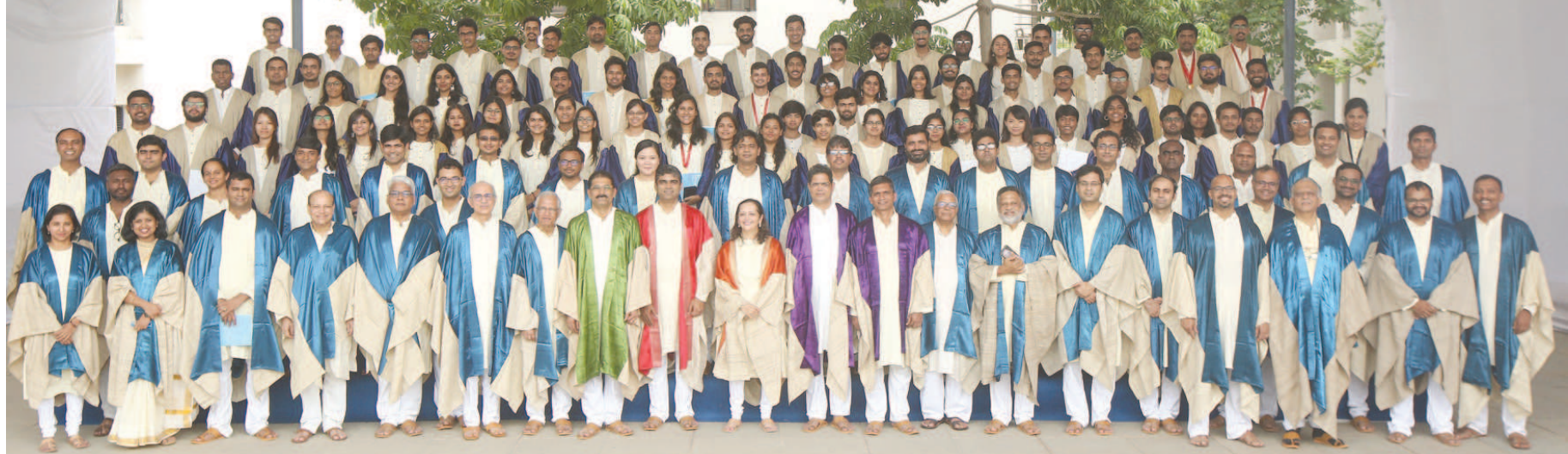
ઈન્ડિયન ઈન્સ્ટીટ્યુટ ઓફ ટેકનોલોજી, ગાંધીનગર ખાતે ૮મા વાર્ષિક પદવીદાન સમારોહનું આયોજન કરવામાં આવ્યું હતું. સમારોહ અંતર્ગત કુલ ૩૯૪ વિદ્યાર્થીઓને ડિગ્રી એનાયત કરવામાં આવી હતી, જેમાં બીટેક, બીટેક-એમટેક, બીટેક-એમએસસી, એમટેક, એમએસસી, એમએ, પીએચડી અને