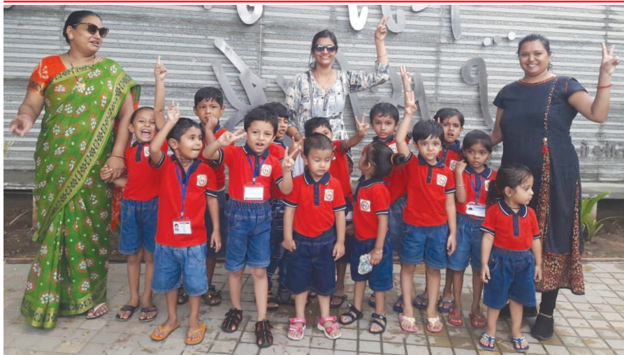
વાવોલમાં કાર્યરત અલ્મા મેટર પ્રિસ્કૂલનાં ભૂલકાઓએ ત્રિમંદિરની અભ્યાસ મુલાકાત લીધી હતી. અહીં દર્શન ઉપરાંત મંદિરની આધ્યાત્મિક પ્રવૃત્તિઓ વિશે પણ બાળકોએ માહિતી મેળવી હતી અને મંદિરના પરિસરમાં રાખવામાં આવેલા હિંચકા પર ઝૂલીને ભરપૂર આનંદ પ્રાપ્ત કર્યો હતો.