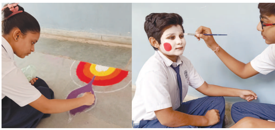
ગાંધીનગર, તા. ૩૦ સર્વ વિદ્યાલય કેળવણી મંડળ સંચાલિત શ્રીમતી આર સી પટેલ સેકન્ડરી અને હાયર સેકન્ડરી સ્કૂલમાં વિદ્યાર્થીઓ માટે વ્યક્તિગત પ્રતિભા સ્પર્ધા યોજવામાં આવી હતી. રંગોળી, મહેંદી અને ફેસ પેઇન્ટિંગ સ્પર્ધા આ ઉપક્રમ અંતર્ગત યોજવામાં આવી હતી. ૩૦ વિદ્યાર્થીઓએ આ સ્પર્ધામાં ભાગ લીધો હતો. મહેંદી સ્પર્ધામાં