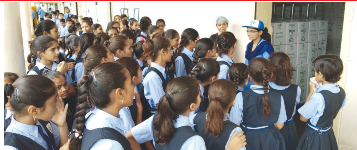
જેએમપી ગોપાલક વિદ્યા સંકુલના વિદ્યાર્થીઓએ મંગળવારે મધુર ડેરીની મુલાકાત લીધી હતી. તેમણે ડેરીના સઘળા વિભાગોની પ્રત્યક્ષ વિદ્યાર્થીઓને ઉમળકાભેર આવકાર આપી ડેરીની સમગ્રવલ્લી કાર્યપ્રવૃત્તિ અંગે માહિતી પૂરી પાડવામાં આવી હતી.