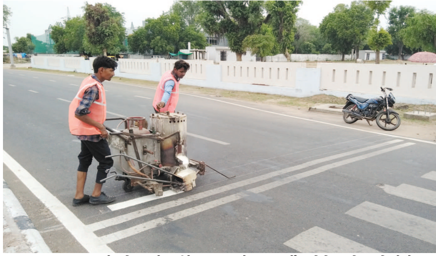
વાહન વ્યવહાર અને ટ્રાફિકના યોગ્ય રીતે સંચાલન માટે મુખ્ય માર્ગો પર વિવિધ ટ્રાફિકના ચિહ્નો દોરવામાં આવે છે. વાહનોની સતત અવરજવર અને વરસાદી પાણીના કારણે આ ચિહ્નો ભૂંસાઈ જાય છે. વાહનોની વધુ અવરજવર ધરાવતા ખ-રોડ પર ડિજિટલ કોલિંગ સહિતના વિવિધ ચિહ્નો દોરવાનું કાર્ય શરૂ કરાયું છે.

માસ્ક ન પહેરનાર હોય તેવા ૧,૩૨૭ વ્યક્તિઓને પકડી પાડવા હતા. જેમાં સેક્ટર-૨૧ પોલીસ સ્ટેશનને ૧૩૭, સેક્ટર-૭ પોલીસ સ્ટેશનને ૯૮, પેથાપુર પોલીસ સ્ટેશનને ૯૩, ડાબોડા પોલીસ સ્ટેશનને ૫૦, ચિલોડા પોલીસ સ્ટેશનને ૧૧૯, દહેગામ પોલીસ સ્ટેશનને ૧૩૮, રબિયાલ પોલીસ સ્ટેશન ૭૧, ઈન્ફોસીટી પોલીસ સ્ટેશનને ૧૫૮, મહિલા પોલીસ સ્ટેશનને ૪૫, અડાલજ પોલીસ સ્ટેશનને ૭૧, કલોલ શહેર પોલીસ સ્ટેશનને ૮૮, કલોલ તાલુકા પોલીસ સ્ટેશનને ૭૮, માણસા પોલીસ સ્ટેશનને ૧૩૭, સાંતેજ પોલીસ સ્ટેશનને ૩૭, ટ્રાફિક પોલીસ શાખાએ ૧૩૭ અને એલ.સી.બી. શાખાએ ૧૩ વ્યક્તિઓને માસ્ક ન પહેરનાર પકડી પાડ્યા હતા. જેમની પાસેથી જાહેરનામાનો ભંગ કરવા પકડાયેલ તમામ વ્યક્તિઓ પાસેથી રૂપિયા ૨,૬૫,૪૦૦ નો દંડ વસૂલ કરવામાં આવ્યો હતો.