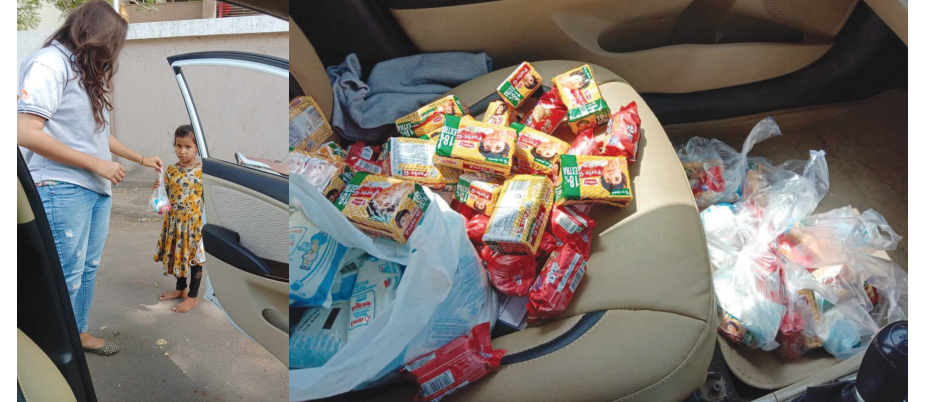
શૈક્ષણિક સંસ્થાઓનું કાર્ય વિદ્યાર્થીઓને શિક્ષણ સાથે સંસ્કાર પુરા પાડવાનું પણ છે. નવોદય ગુજરાતના ભૂતપૂર્વ વિદ્યાર્થીઓના એલ્યુમ્ની એસોસિએશન ઓફ નવોદય ગુજરાત - 'આન' દ્વારા વખતોવખત સમાજને ઉપયોગી પ્રવૃત્તિઓનું આયોજન કરવામાં આવે છે જે અંતર્ગત તાજેતરમાં કોબા રોડ પરની જરૂરિયાતમંદ વર્ગના શ્રમજીવી પરિવારોની સેવા વસ્તીમાં ૫૦ જેટલાં બાળકોને દૂધ તથા બિસ્કીટનું વિતરણ કરવામાં આવ્યું હતું.