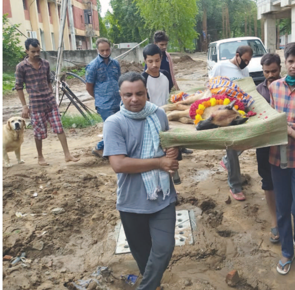
શ્યાનનું મૃત્યુ થતા ફાયર ઓફિસરે અંતિમ વિદી કરી

પોલીસ તંત્ર દ્વારા દરરોજ હોમ ક્વોરન્ટાઈન વ્યક્તિની તપાસ કરવામાં આવશે. રાજ્યના પાટનગરમાં કોરોનાના કેસનો આંકડો રોજ વધી રહ્યો છે. કોરોના પોઝીટીવ દર્દીઓનો આંકડો ૮૦૦ ને પાર કરી ગયો છે. જ્યારે ગુજરાતમાં કોરોનાના કેસ ૩૮ હજારથી વધુ છે. રાજ્યના વિવિધ શહેરોમાં કોરોનાના કેસ ઘટવાને બદલે ચિંતાજનક રીતે વધી રહ્યા છે. ત્યારે કોરોનાના કેસનું સંક્રમણ ઓછું થાય