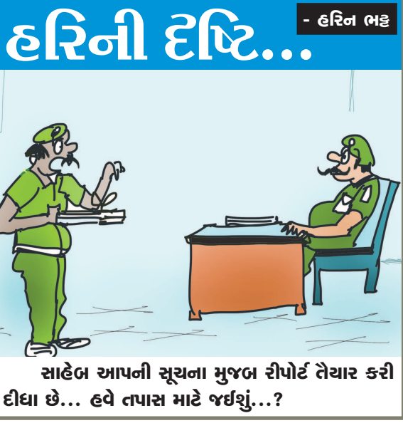
સાહેબ આપની સૂચના મુજબ રીપોર્ટ તૈયાર કરી દીધા છે... હવે તપાસ માટે જઈશું...?