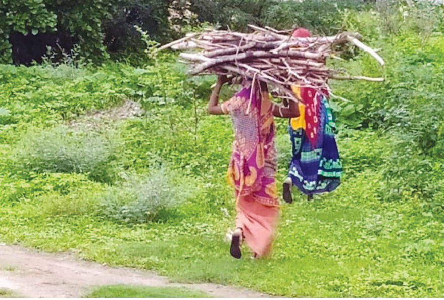
‘પેટ કરાવે વેઠ...’ એ કહેવત કઈ અમથી જ નહીં પડી હોય. પેટનો પાડો પૂરવા મહેનત મજૂરીથી લઈને સૂકા લાકડા વિણવા સુધીની મજૂરી કરવી પડે છે તેને જ સમજાય. ઉજ્જવલા યોજના હેઠળ ઠેર ઠેર ગેસના યુવાનું વિતરણ તો કરવામાં આવ્યું પરંતુ રાંધણ ગેસનો બાટલો એટલો મોંઘો પડે છે કે ગરીબ પરિવારો ના છૂટકે બળતણ માટે લાકડાનો ઉપયોગ કરવો પડે છે. વળી વરસાદી વાતાવરણમાં સૂકા લાકડાંઓ ન મળવાની મુશ્કેલીનો સામનો પણ કરવો પડે છે.

એટલે દિવસનો એક કલાક માંડ ફોન રમતા પણ ઓનલાઈન શિક્ષણ થવાથી બાળકો દ્વારા પણ ઈન્ટરનેટનો વપરાશ વધ્યો છે. વર્ક ફ્રોમ હોમ કરનાર કર્મચારીને પણ ઓફિસના સમયે ઈન્ટરનેટ જરૂરી છે ત્યારે આ દરેક કારણોસર ઈન્ટરનેટ ટ્રાફિકીંગનું પ્રમાણ વધ્યું છે અને શહેરના અમુક વિસ્તારમાં તો નેટવર્ક કનેક્ટીવિટીના પણ ઘણા પ્રોબ્લેમ છે. જેને લીધે મોબાઈલ કંપની તથા બ્રોડબેન્ડ કંપનીના કસ્ટમર કેર સેન્ટરની બહાર પણ વધુ પ્રમાણમાં લાઈન જોવા મળે છે. શહેરમાં ખાસ કરીને અમુક વિસ્તારમાં વોડાફોન અને એટેલ્લો નેટવર્ક આવતું જ નથી. કસ્ટમર કેર નંબર પર ફોન કરતા લાઈન કનેક્ટ થતી નથી અથવા તો કોલ જ લાગતો નથી. કસ્ટમર કેર સેન્ટરની મુલાકાતે કોરોનાના ડરથી અમુક શહેરીજનો જતા નથી અને જે જાય છે તેમને લાંબી લાઈનોમાં ઉભું રહેવું પડે છે. મોબાઈલ ડેટાનો વપરાશ નગરમાં એટલો વધી ગયો છે કે લગભગ દરેકના ફોનમાં એક દિવસની સ્કિમ મુજબનો ડેટા પૂર્ણ થઈ જાય છે. આ ઉપરાંત બ્રોડ બેન્ડની સેવાની વાત કરીએ તો જીટીપીએલ, ટીકોના અને જીઓ હાલ ખાસ ચલણમાં છે ત્યારે એક કરતા વધુ ડીવાઈઝ કનેક્ટ થાય એટલે સ્પીડ ઘટી જાય છે. અને પછી દિવસ દરમિયાન સ્પિડ જ નથી આવતી. સવારના ૮ થી ૧૨નો સમય અને સાંજના ૬ થી ૧૨ પછીના સમય દરમિયાન સૌથી વધુ ઈન્ટરનેટ ટ્રાફિકીંગનો ઈશ્યુ થઈ રહ્યો છે. હવે મોબાઈલ કંપની આ પ્રશ્નોનું નિરાકરણ લાવે અને બ્રોડ બેન્ડ કંપનીઓ પણ નેટવર્ક કનેક્ટીવિટીમાં શહેરના દરેક વિસ્તારમાં સુધારો વધારો કરે તેવી શહેરીજનોની માંગ છે.