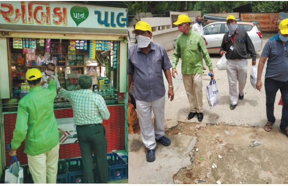
નારિકોને મદદરૂપ થવા તત્પર જોવા મળી રહી છે. પાટનગરની મીનાબજાર ખાતે આ અંતર્ગત વેપારીઓને કોરોના વાયરસથી