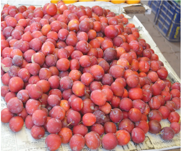
દરેક ઋતુના એક ખાસ ફળ હોય છે. હાલમાં વરસાદી સિઝન શરૂ થતાં બજારમાં જાંબુ અને રાસબરી જેવા ખટ્ટ મીઠા ફળોની સિઝન જામી છે. લારીઓ પર તેના ઢગલે ઢગલા જોવા મળી જાય છે. જો કે આ અવરવા કળી થોડાક મોંઘા જરૂર છે પરંતુ તેનો સ્વાદ તો સિઝન દરમિયાન એકાદ-બે વખત તો ચોક્કસ માણી શકાય.