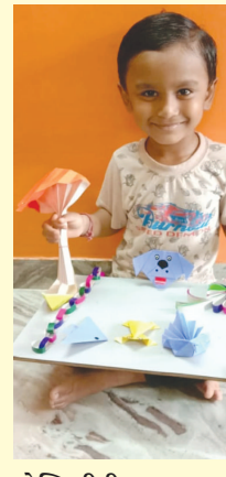
એક્ટિવિટી પણ કરવામાં આવે છે. જેમાં બાળકો તથા વાલીઓનો ખૂબ સહકાર મળ્યો હતો.

ગાંધીનગર, તા. ૧૫ કડી સર્વ વિદ્યાલય કેળવણી મંડળ સંચાલિત એસ કે પટેલ કે જી ઈંગ્લિશ મીડિયમ સ્કૂલમાં ‘ઓરેગામી એક્ટિવિટી’ નો કાર્યક્રમ યોજાયો હતો. જેમાં બાળકોએ ઓરેગામી પેપરમાંથી ‘કેટ, પ્લેન, ફિશ, બોટ, પર્સ, પેપર બેગ અને હાઉસ’ બનાવ્યા હતા. જેમાં વાલીઓએ પણ તેમાં ખૂબ જ ઉત્સાહપૂર્વક ભાગ લીધો હતો. તથા વાલીઓનો પણ ખૂબ જ સારો સહકાર મળ્યો હતો. સ્કૂલમાં અવારનવાર ઓનલાઈન કલાસમાં શિક્ષણની સાથે આવી