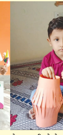
વાલીઓનો ખૂબ સહકાર મળ્યો હતો.