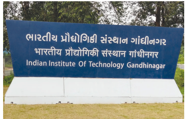
ભારતીય પ્રૌઘોગિકી સંસ્થાન ગાંધીનગર ભારતીય પ્રૌઘોગિકી સંસ્થાન ગાંધીનગર Indian Institute Of Technology Gandhinagar

ગાંધીનગર, તા. ૧૬ ભારતીય પ્રૌઘોગિકી સંસ્થાન ગાંધીનગરે (આઈઆઈટી ગાંધીનગર) એન્જિનિયરિંગ, સાયન્સ તેમજ હ્યુમેનિટીઝ અને સોશિયલ સાયન્સના તમામ ક્ષેત્રના તાજેતરના ડોક્ટરેટ્સ માટે આઈઆઈટી ગાંધીનગર અર્લી-કરિયર (આઈઆઈટીએન-ઈસીએફ) શરૂ કરી છે. આ ફેલોશિપ