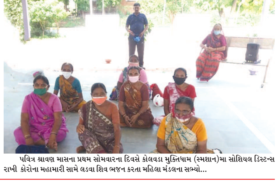
પવિત્ર શ્રાવણ માસના પ્રથમ સોમવારના દિવસે કોલવડા મુક્તિધામ (સ્મશાન)મા સોશિયલ ડિસ્ટન્સ રાખી કોરોના મહામારી સામે લડવા શિવ ભજન કરતા મહિલા મંડલના સભ્યો...